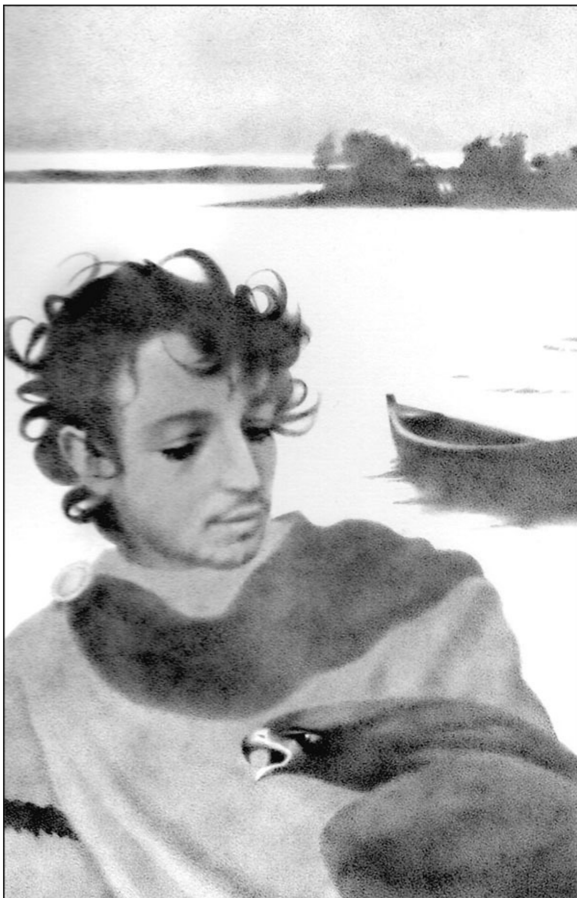
Юноша с орлом