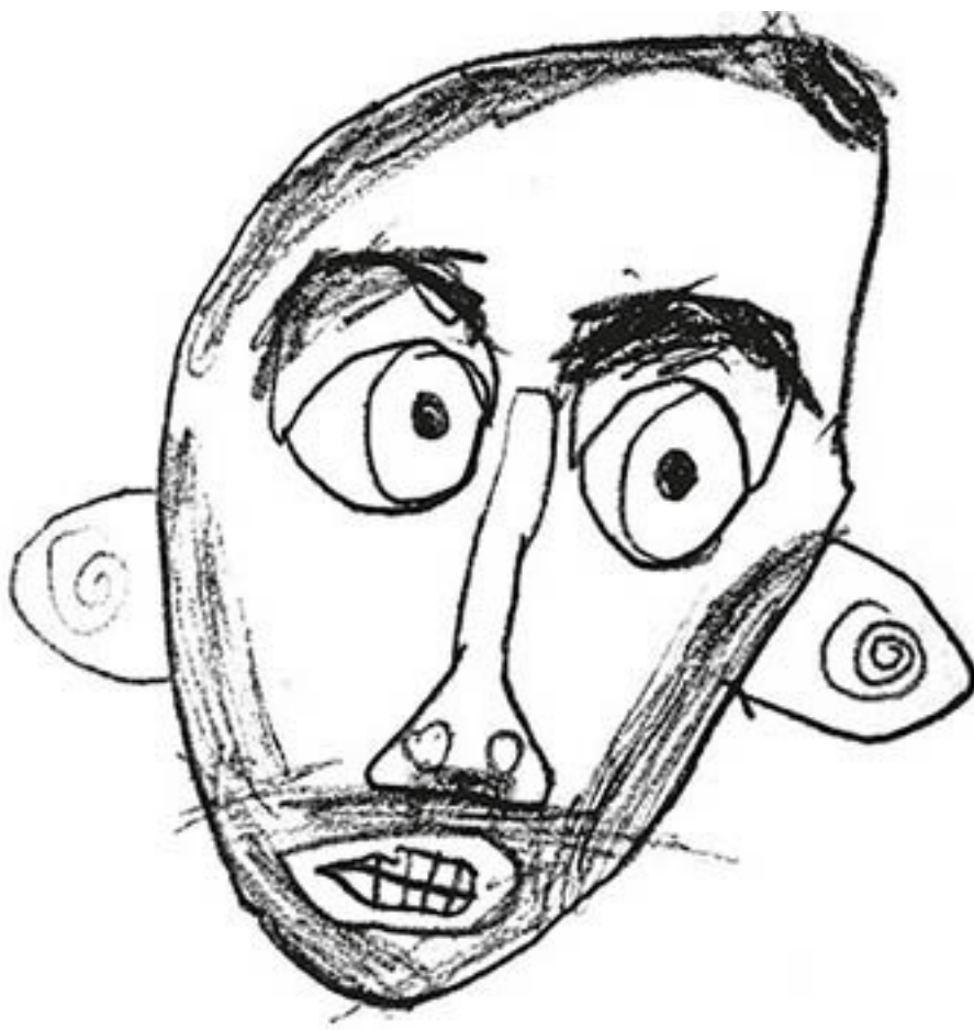
Иллюстрация Мирона Лысикова, карандаш