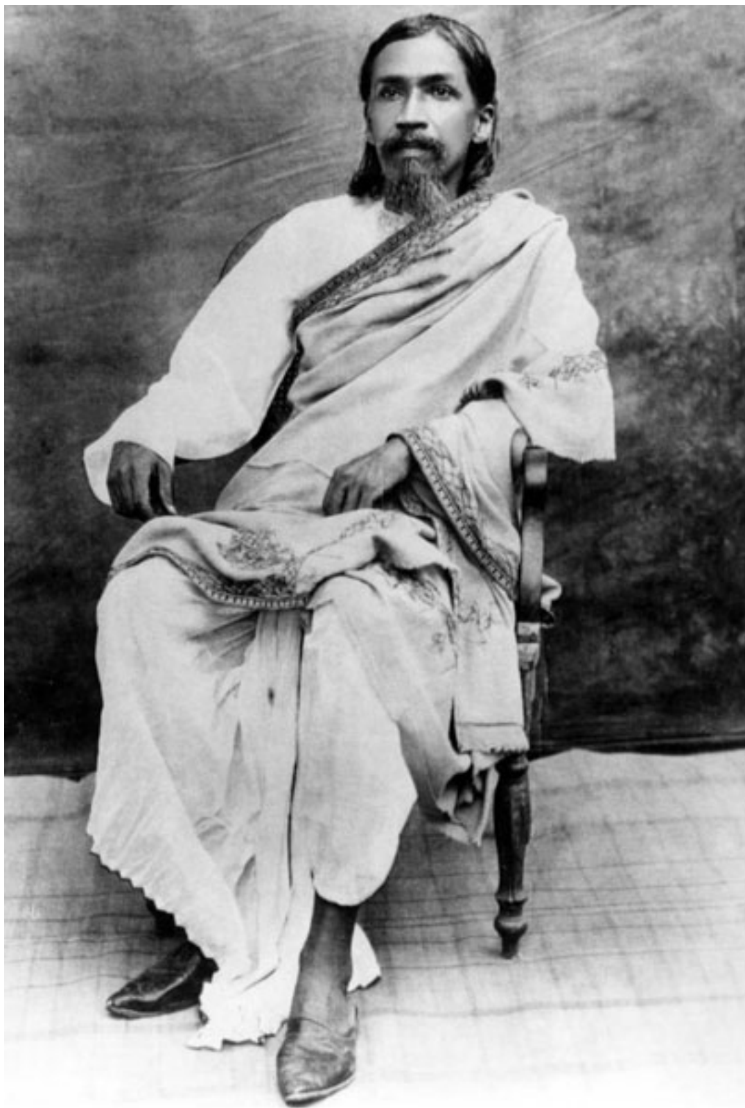
Шри Ауробиндо, Пондичери, 1915—1918 г.