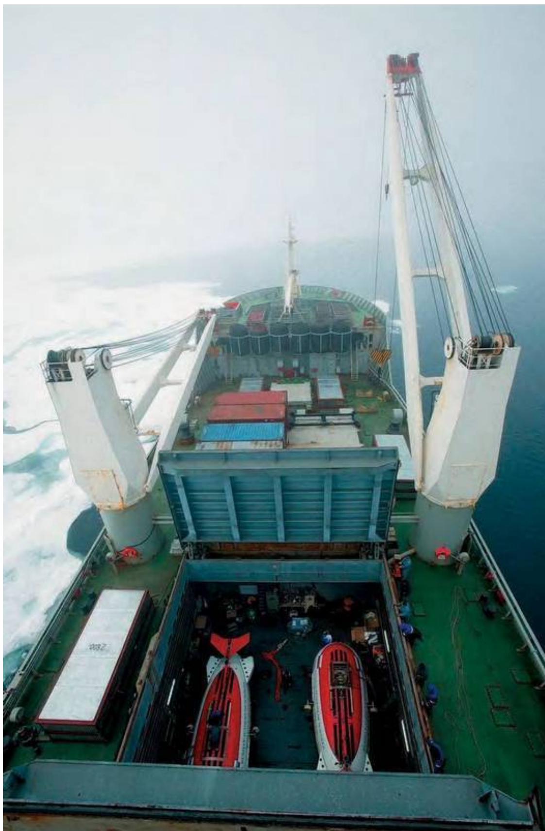
2 августа, Северный полюс. Аппараты «Мир-1» и «Мир-2» готовятся к погружению на дно Северного Ледовитого океана.