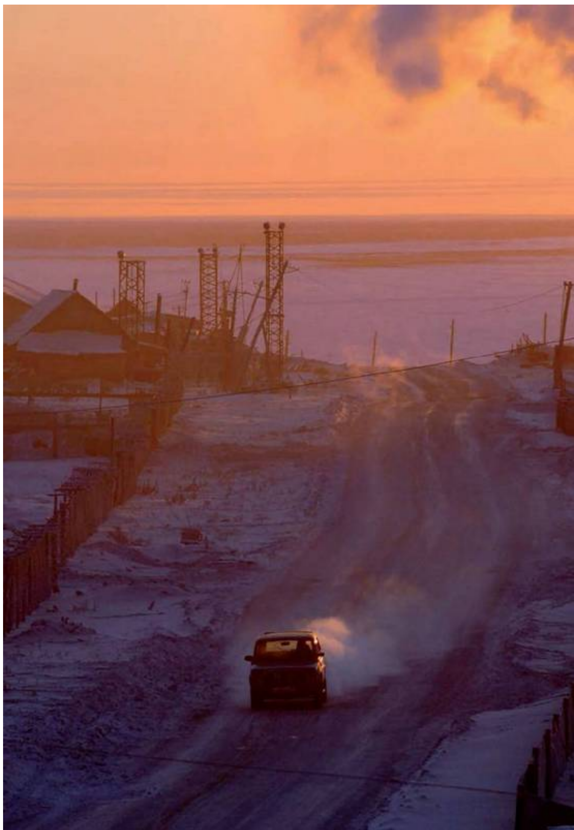
Хатанга, январь. Солнце вновь появляется над горизонтом после двух месяцев полярной ночи.