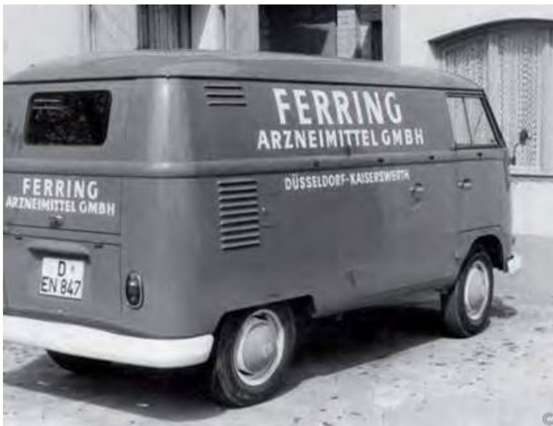
Германия, 1960-е. Первые шаги международной компании.