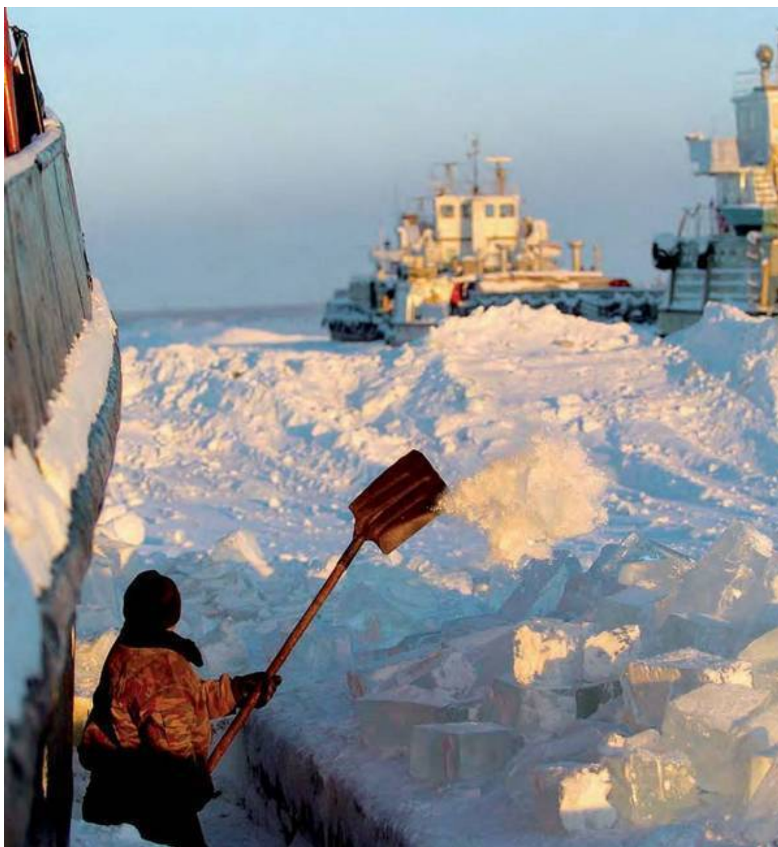
Порт Хатанга скован льдом семь месяцев в году (на фото освобождают ото льда винты судна).