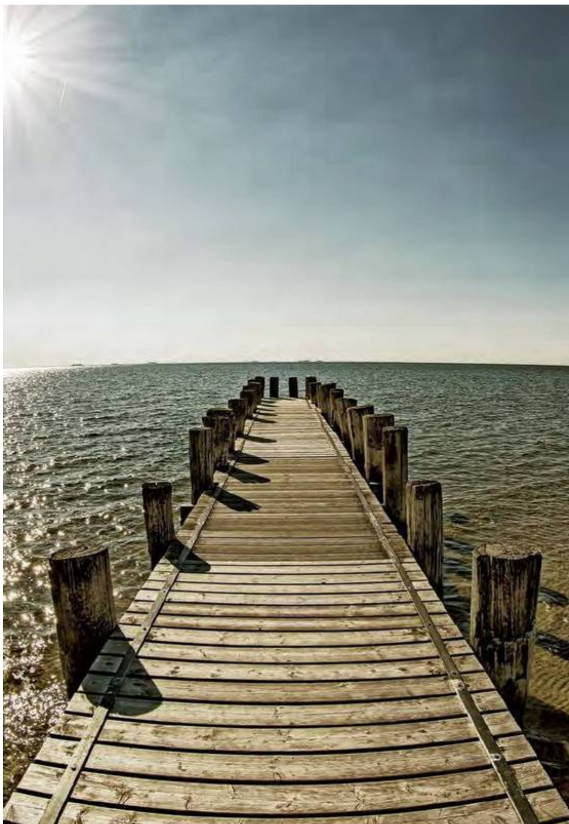
Фёр – один из Фризских островов, залитый волшебным светом.