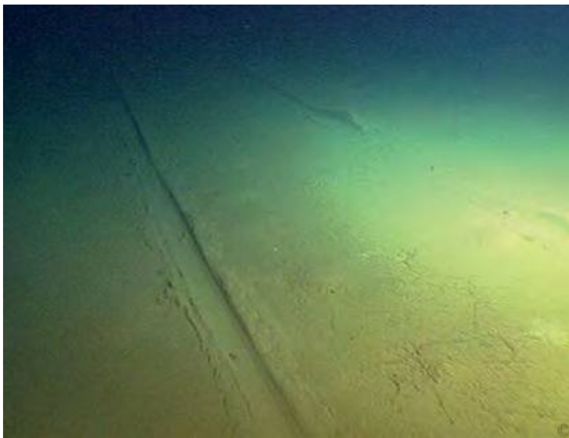
Следы батискафа на илистом дне настоящего Северного полюса, на глубине 4302 метра.

Долгое время развитие технологий было единственным ключом к исследованию Северного полюса. Если согласиться с мнением большинства специалистов, что Роберт Пири обманул весь мир, заявив о достижении Северного полюса в 1909 году, то получится, что в первый раз человек добрался до этого места благодаря дирижаблю «Норвегия», пролетевшему над ним 13 мая 1926 года. 1 Первыми, кто совершенно неопровержимо ступил на льды Северного полюса, стали советские граждане – члены высокоширотной воздушной экспедиции «Север-2» под руководством Александра Кузнецова, прибывшие на трех самолетах 23 апреля 1948 года. Американская атомная подводная лодка «Наутилус» прошла над полюсом 10 лет спустя, потом подводная лодка «Скат» вышла на поверхность, разломав толщу молодого льда. 2 Без помощи техники Северный полюс удалось достичь лишь 5 апреля 1969 года. Именно тогда Уолли Герберт и его товарищи направили к нему собачьи упряжки... всего за три месяца до того, как «Аполлон-11» высадил Армстронга и Олдрина на Луну!