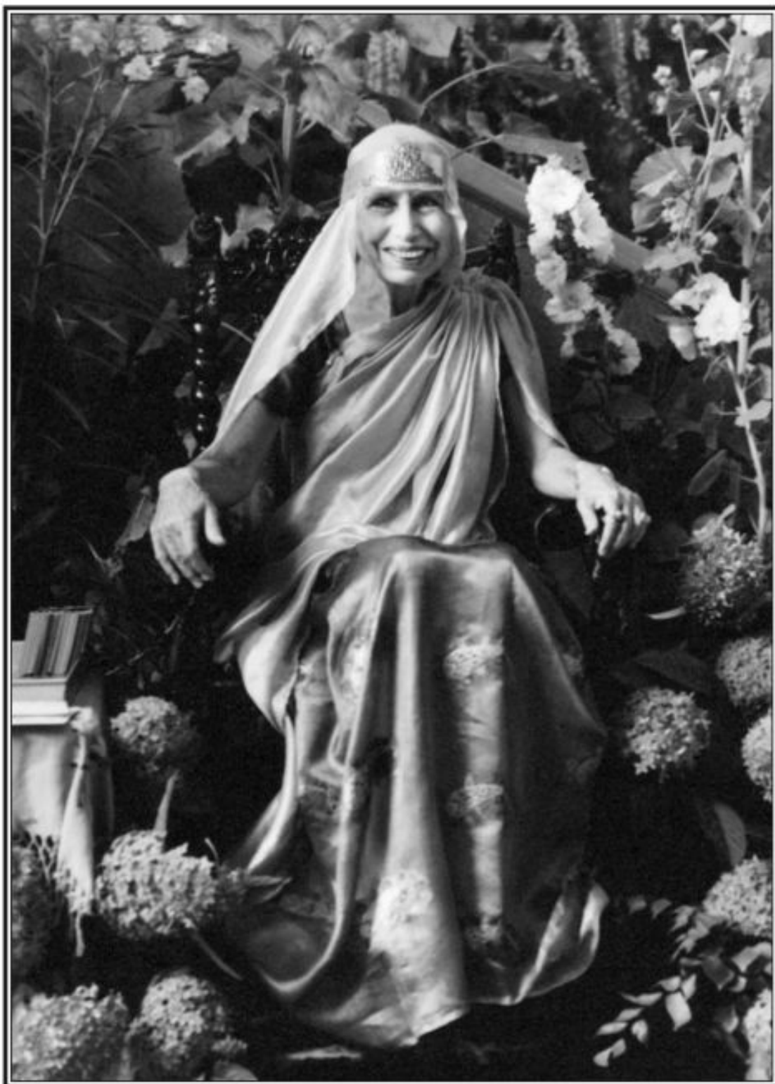
Мать – 1954 г.