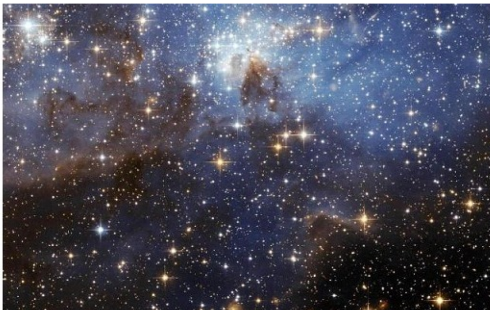
Космическое фото телескопа Хаббл

Но если астрософия была обречена на забвение, то такому её философскому ответвлению, как «Гармония космических сфер» , повезло значительно больше. Это популярное в античную и средневековую эпоху учение о музыкально-математическом устройстве космоса, характерное для пифагорейской, платонической, аристотелевской философской традиции.