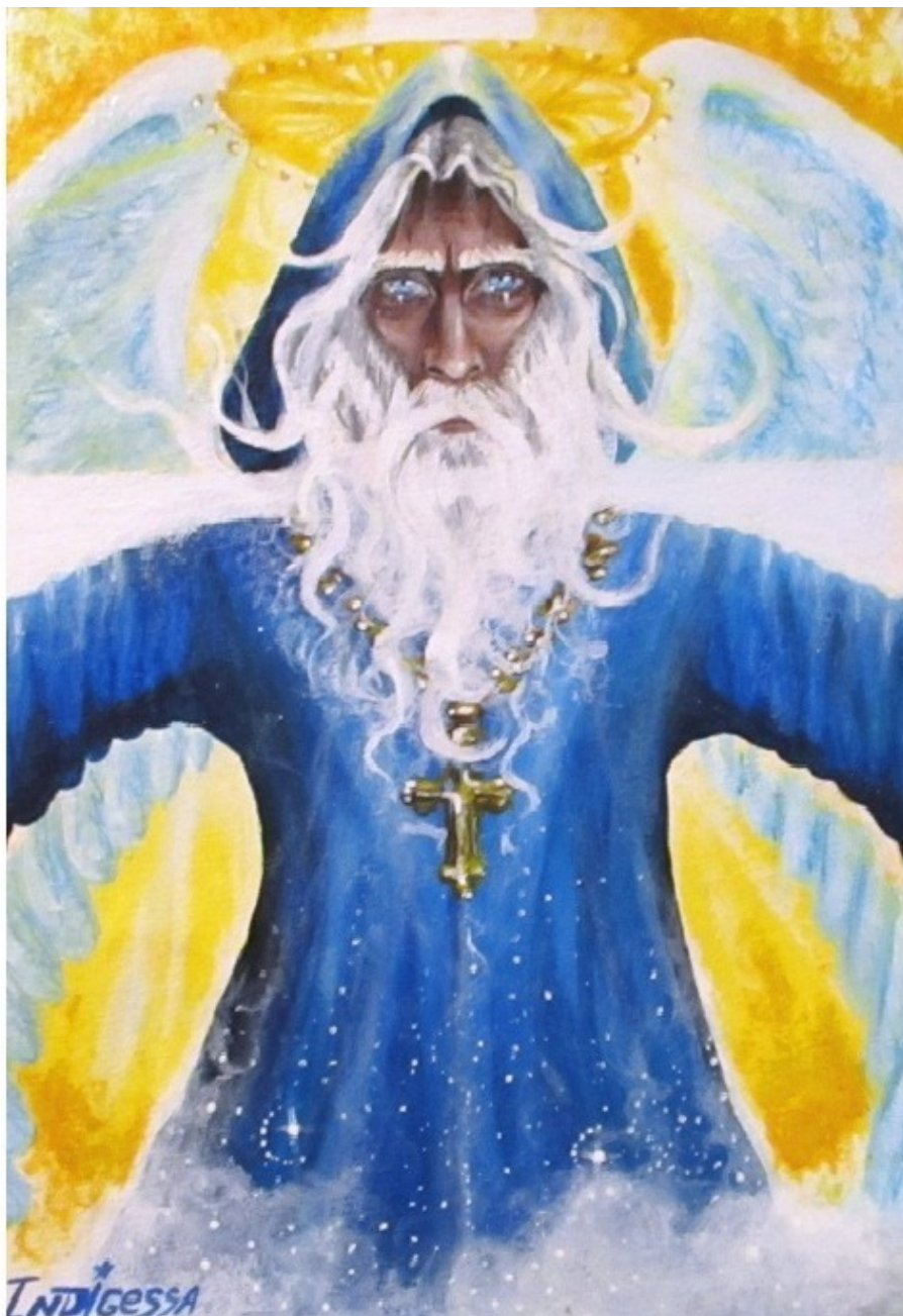
«Ангел-Креститель» авторская картина Инессы Рэй Индиго

*ЭАСАЭЛЬ (ЭЛИЯ) [Иисус – греч., Езус – кельт., Исайа – общесемит., Азу – аккадско-шум., Шу и Аш – др. египет., Иешуа – арамейский] Иисус»? араб. Иса, евр. Иешуа или Иегошу; Сусо – с древнеяпонского «Бог»; Сава – с иврита «старец» и «восседать»; Seven – с англ. «семь»; Шеба – с иврита «семь»; Save – с англ. «спасение»; Сабба – с арабск. «креститель»]