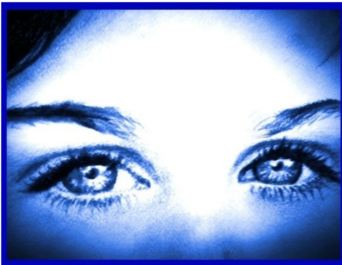
авторский рисунок Инессы Рэй Индиго (Indigessa)

По мере взросления не по годам просветлённого ребёнка с особой энергией, что стала с лёгкой руки американских парапсихологов называться «индиго», масса не прояснённых вопросов и глобальных тайн не давала покоя. Земные и детские загадки щёлкались в миг, как орешки. Потому заботили, постепенно оформляясь в цель существования, только самые сложные философские вопросы, на которые и старейшины в ответ лишь пожимали плечами или прикрывали пробелы общими пространственными формулировками. Так, с годами философского поиска простые и гениальные ответы вспыхнули в разуме, словно сверхновые звёзды в космической мгле. И этот свет новых или хорошо забытых людьми знаний, когда-то считавшихся уникальным дарованием свыше, необходимо распространить среди людей.