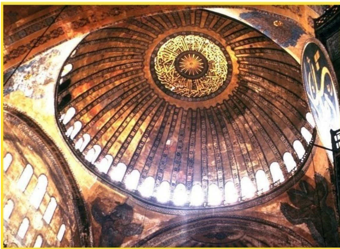
Фото храма в Софии

Теперь рассмотрим поближе божественные силы Солнца. Предлагаю проследовать в соседнюю залу, осенённую золотым светом. Там взору предстаёт аскетичная, но искусно исполненная башенная комната, со стен которой на нас печально смотрят святые с жёлтыми нимбами, в точь повторяющие контуры солнечной сферы. А над головами любопытных экскурсантов лишь старый золотой купол, в раскол которого таинственно подмигивает Луна.