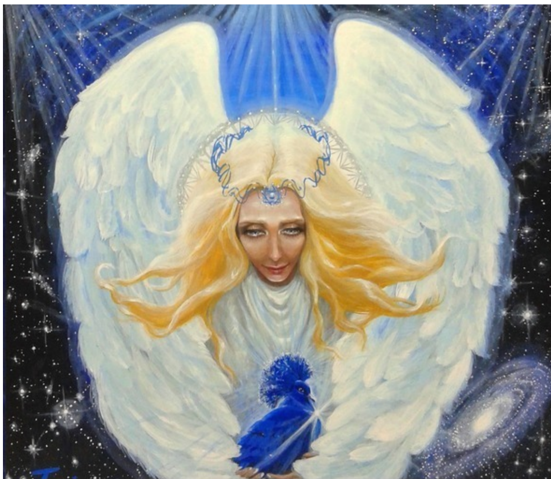
«Ангел Сириуса» авторская работа Инессы Рэй Индиго

Согласно Астротеизму , основанному на возрождённых знаниях, число истинных астральных богов Вселенной неизменно равняется 12. Это максимальный и предельный спектр превращений звёздного вещества. Потому в человеческой культуре эта гармоничная цифра является своеобразным камертоном (12 месяцев, 12 астрологических знаков, 12 апостолов, 12 сивилл и многого другого). За пределами этой системы уже нет других форм духовной жизни, кроме демонической, то есть умирающей, и потому она всегда ассоциируется с числом смерти 13.