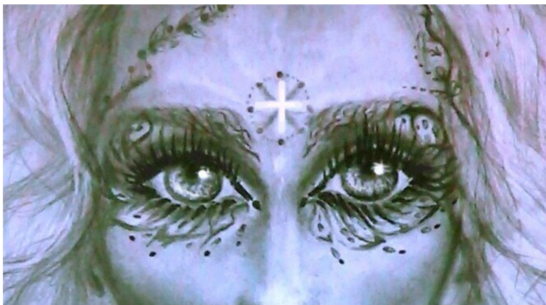
«Звёздная богиня», авторский рисунок Инессы Рэй Индиго

Уверена, многие особенно задумаются об упомянутой дюжину небесных богинь. А как же заоблачный белобородый мудрец или Великий архитектор, отстроивший в одиночку всю прекрасную Вселенную? Астротеизм не исключает участие в жизни нынешних землян богов с мужской энергией и образами. Да только все они на самом деле имеют исключительно солнечную природу, потому что мужественной энергией обладают исключительно ангелы деградирующих звезд или часть уже падших ангелов. Последним человеческим этапом сансары перед тем, как стать звёздным обитателем, астрал проживает именно женскую жизнь (9 этап «Индиго»).