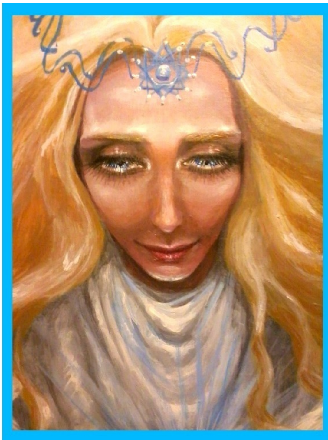
Фрагмент авторской картины «Ангел Сириуса»

Землянам, как заложникам патриархального магнетизма разрушающегося Солнца, будет непросто привыкнуть к тому, что настоящий Творец Вселенной и её звёздного урожая это не седовласый Бог, а цветущие Богини. У истинных божественных сил материнское лицо. А главные миссии – это любовь, забота, мудрость, развитие, созидание и самопожертвование. Аргументов из бородатого эпоса и древних верований можно привести массу, но все они ничто по сравнению с собственным опытом познания, с одним лишь нежным взглядом синеглазой богини сквозь сотни световых лет. Для них люди никогда не будут «рабами Божьими», ведь человечество в незримом рабстве только у демонов и у чужих солнечных богов. Для богинь