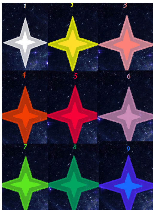
Схема развития души в теории «Астротеизм»

9 «синий» – этап последней и самой совершенной многолучевой звёздочки цвета «Индиго» традиционно женский. Вопреки ложному стереотипу, постепенно достигнуть высшей степени просветления может каждый землянин, а не только инопланетные гости. Индивиды-индиго облагораживали земной мир ещё с древности, с тех самых пор, как появилась разумная и развивающаяся духовная жизнь. Но такая внутренняя энергия души бывает только у девочек, поскольку ангельский и божественный астрал должен иметь материнские свойства. Это энергия жизни, созидания, самопожертвования, любви и мудрости.