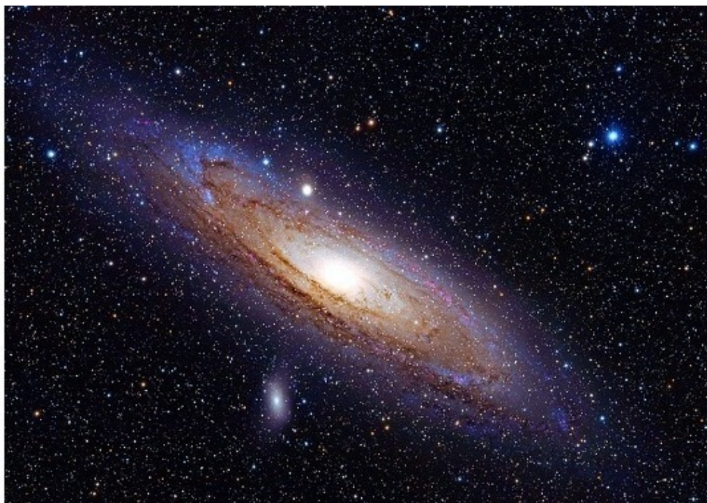
Космический снимок галактики

Однажды, дитя-индиго вглядывалось в ночное, усеянное калейдоскопом звёзд, небо. Глубокий пронзительно-синий взгляд то удалялся на сотни световых лет ввысь от земли, то возвращался и всматривался внутрь себя. И следующее простое открытие стало основным для философской теории о бессмертии душ, которые должны постепенно становиться звёздными богами. Ещё тогда оно получило простое и логичное название «Астротеизм». Небесные светила и человеческие души зажигаются и гаснут одинаково, отличаясь лишь размерами и зрелостью энергетического вещества, а каждая душа – это миниатюрный механизм, цель которой непрерывное производство того самого душевного тепла и света.