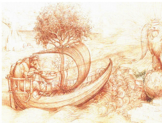
Репродукция рисунка Леонардо Да Винчи.

Остатки различных этносов выживали в подземелье и, дождавшись затишья, выбрались уже к жёлтому солнечному свету. К тому времени уже завершились два губительных этапа сброса плазменных слоёв Солнца вместе с двумя плеядами его звёздных ангелов. Так на изуродованной земле началась эпоха господства падших ангелов Солнца. Поразительно, но древние сакральные знания об отдалении голубой планеты от голубого гиганта созвездия «Большой Пёс», таинственным образом полученные великим художником и мистиком Леонардо да Винчи, иллюстрируются одним его символическим рисунком.