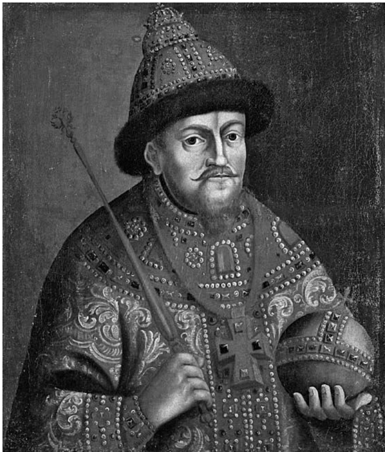
Неизвестный художник. Портрет царя Михаила Федоровича Романова.