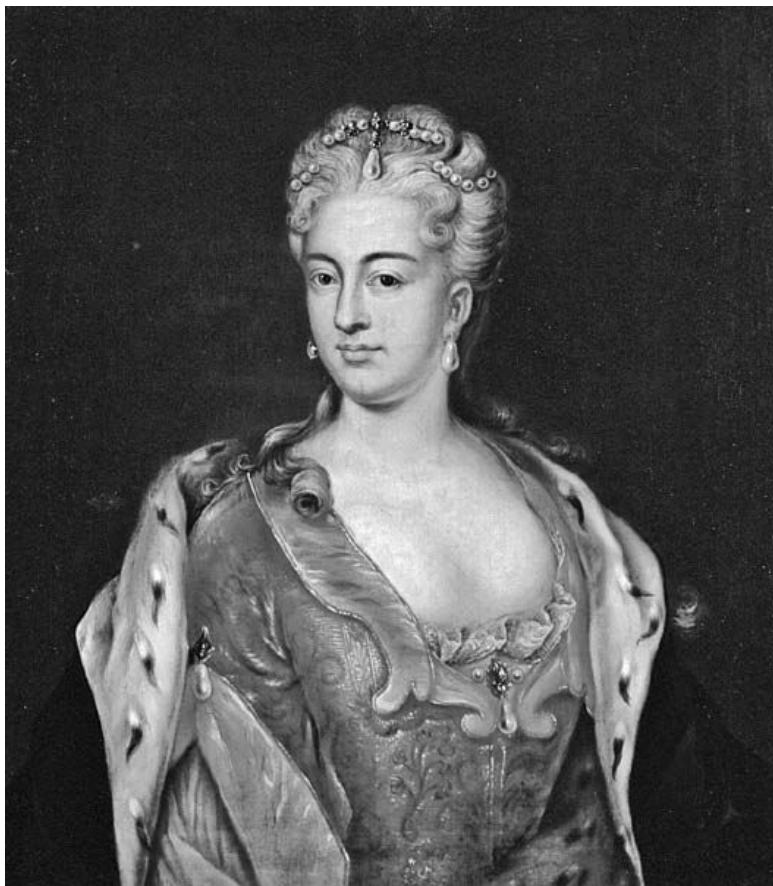
Неизвестный художник. Портрет принцессы Шарлотты Кристины Софии Брауншвейг-Вольфенбюттельской.