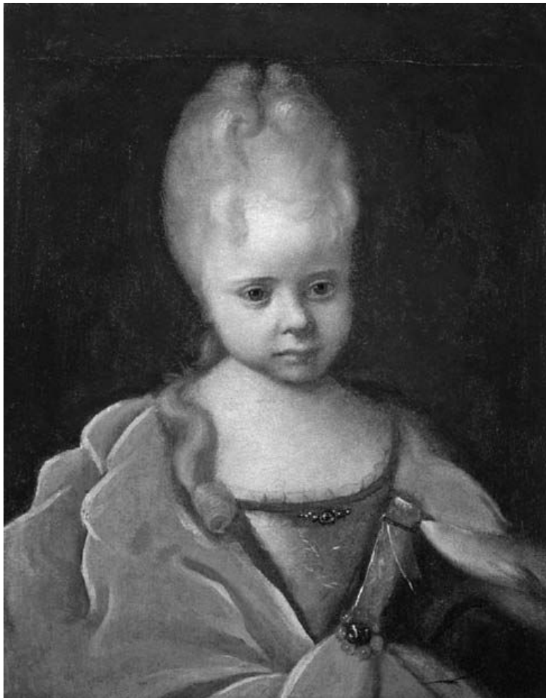
Никитин И. Н. Портрет Елизаветы Петровны ребенком.