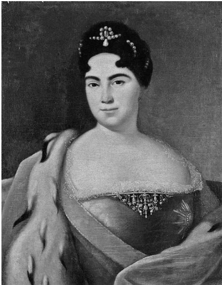
Неизвестный художник. Портрет императрицы Екатери-