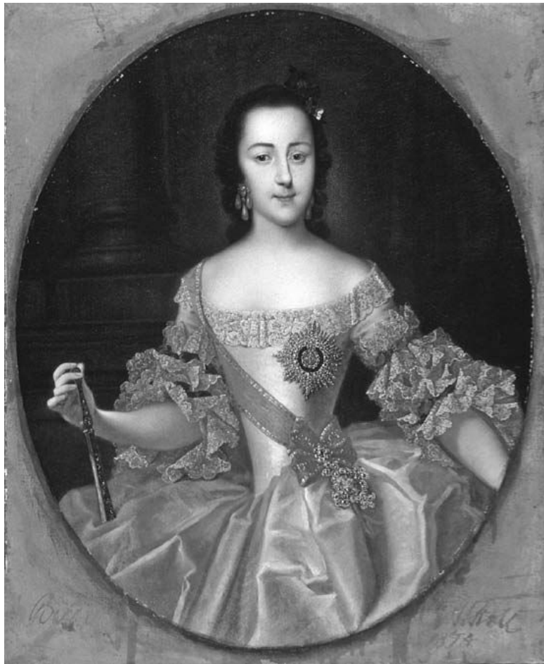
Гроот Г.-Х. Портрет великой княгини Екатерины Алексеевны в юности.