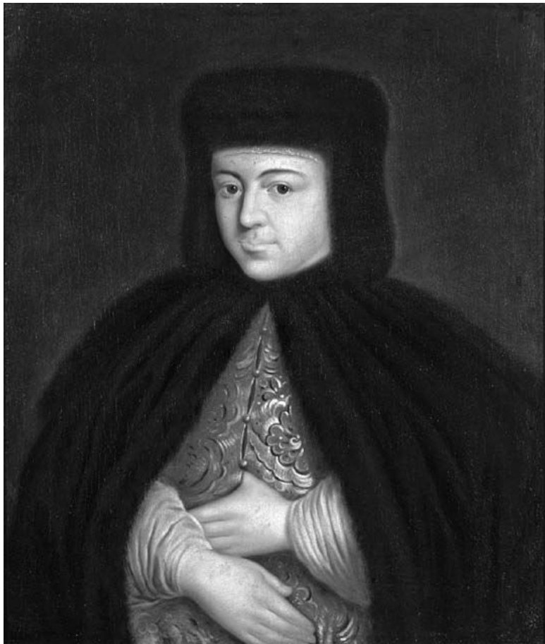
Неизвестный художник. Портрет царицы Натальи Кирилловны. Источник: Государственный Эрмитаж