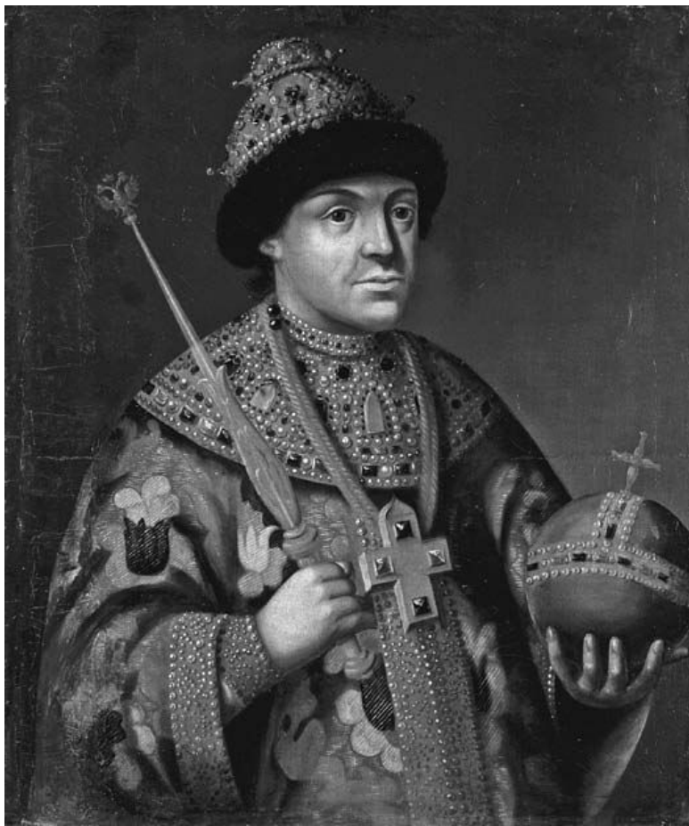
Неизвестный художник. Портрет царевича Федора Алексеевича Романова.