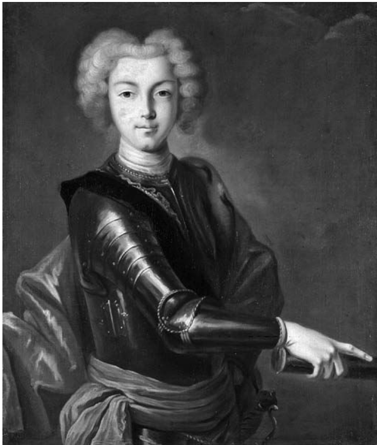
Неизвестный художник. Портрет императора Петра II.