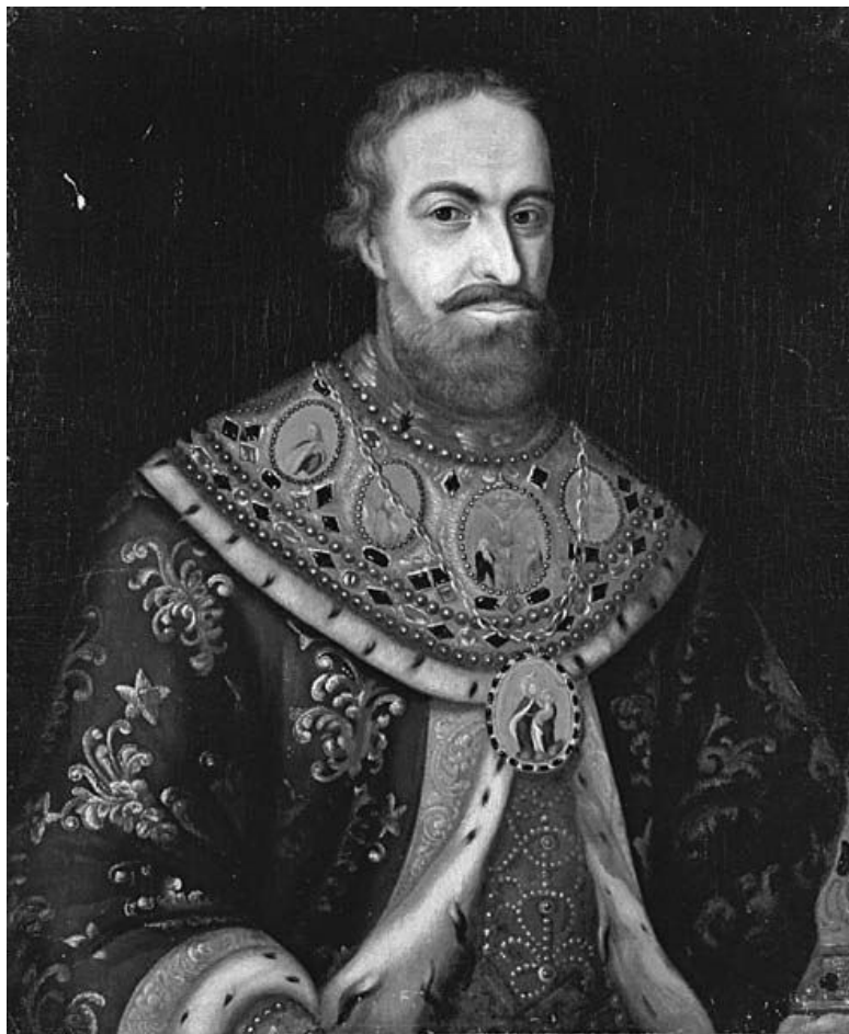
Неизвестный художник. Портрет патриарха Филарета Никитича Романова.