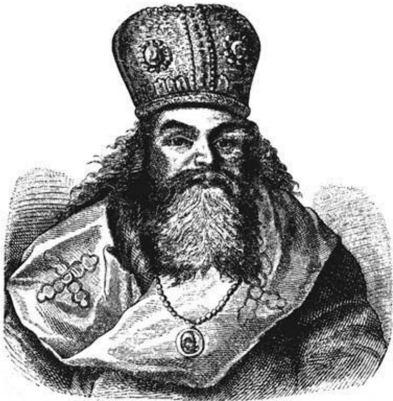
Неизвестный художник, гравюра на дереве 1730-е гг. Портрет Феофана Прокоповича. Из книги: Ровинский Д. А. Подробный словарь русских гравированных портретов. СПб., 1889