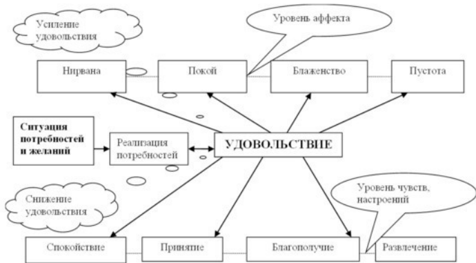
Диаграмма 3. Схема управления эмоцией удовольствия