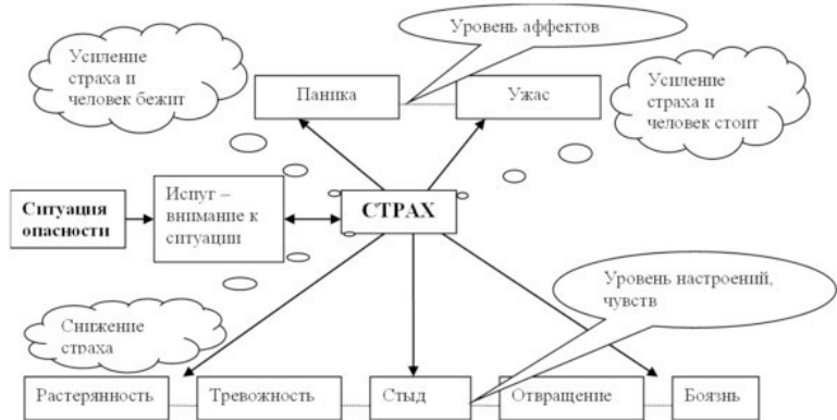
Диаграмма 2. Схема управления эмоцией страха