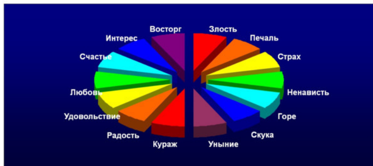
Диаграмма 1. Круг базовых эмоэнграмм по парам