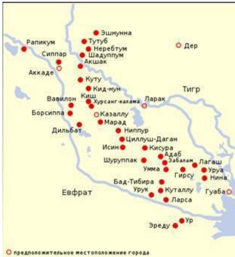
Рис. 7. Древняя Месопотамия