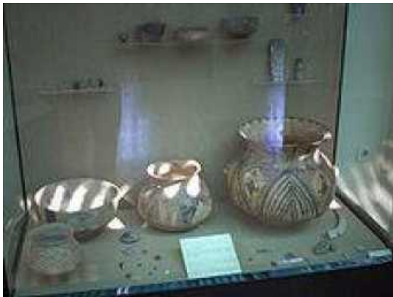
Рис. 2. Керамика