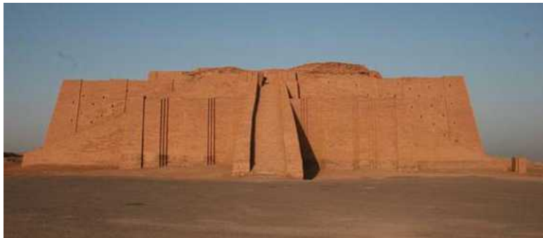
Рис. 8. Древний храм Месопотамии

Ранние протогосударства Двуречья были знакомы с достаточно сложным ирригационным хозяйством, которое поддерживалось в рабочем состоянии усилиями всего населения во главе с жрецами. Храм, выстроенный из обожженного кирпича, был не только крупнейшей постройкой и монументальным центром, но одновременно и общественным складом, и амбаром, где размещались все запасы, все общественное достояние коллектива, в который уже включалось и некоторое количество пленных иноземцев, использовавшихся для обслуживания текущих нужд храма. Храм был также центром ремесленного производства, включая и металлургию бронзы.