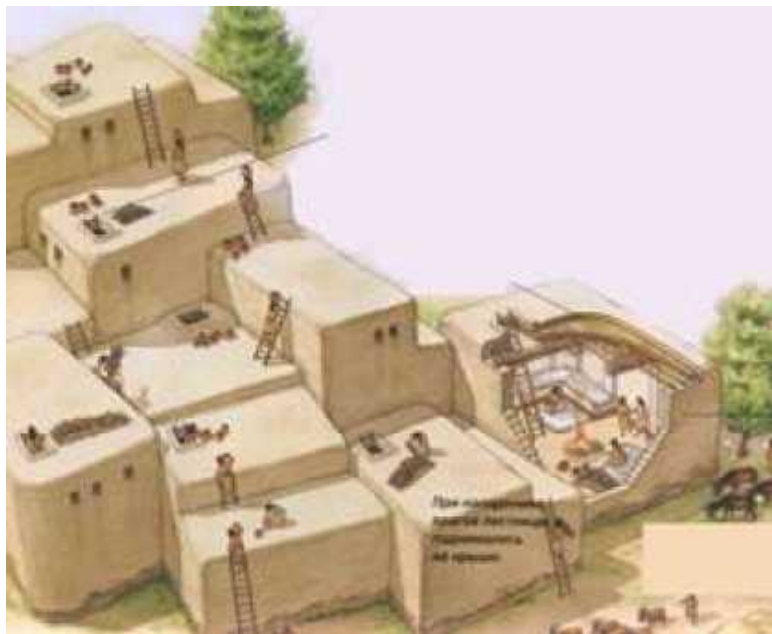
Рис. 3. Возможно, так выглядело поселение