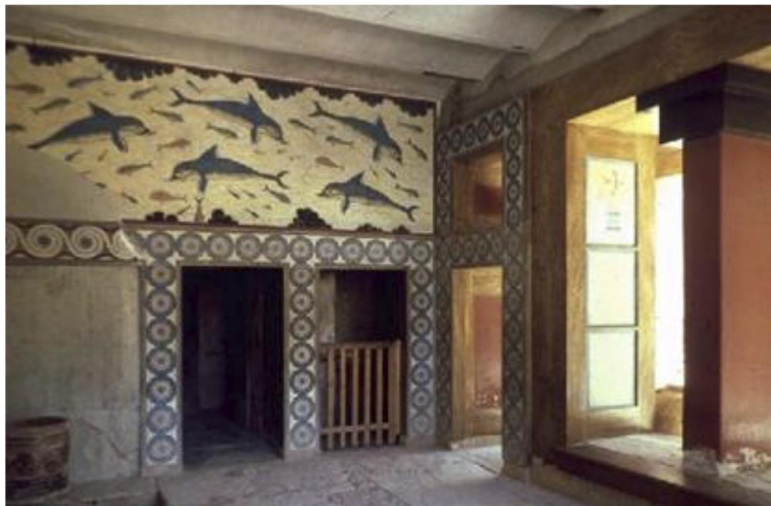
Рис. 10. Интерьер дворца в Кноссе

Жизнь критян осложняли природные катаклизмы. Землетрясения, частые в этих местах морские штормы, сопровождающиеся грозами и ливневыми дождями, засушливые годы – все это периодически обрушивалось на Крит. Защитой жителям служили боги. Центральной фигурой минойского пантеона была великая богиня – «владычица». Так именуют ее надписи, найденные в Кноссе и в некоторых других местах. В этом разноликом образе угадываются общие черты древнего божества плодородия – великой матери всех людей, животных и растений, почитание которой было широко распространено в странах Средиземноморья, начиная с эпо-