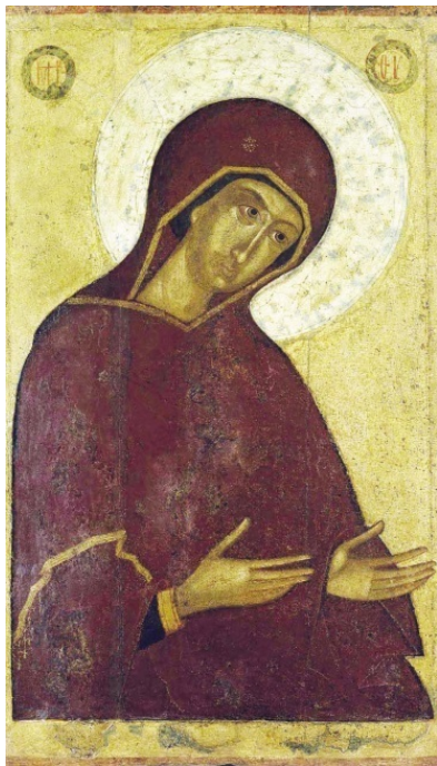
Икона Божией Матери из деисисного чина. 1-я пол. XV в.

И как чудно сбылось это обещание! Тот, кто однажды доверил Ей свою жизнь, приобрел в Ней неизменную Заступницу.