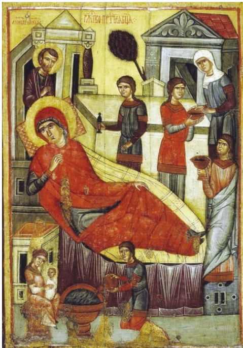
Рождество Богородицы. Икона. Середина XIV в.

Всего трех лет от роду Пресвятая Дева была введена во храм Иерусалимский. При храме в то время проживали мужи и жены – из вдов и девиц, ведущие чистый, благочестивый образ жизни. Это был как бы первообраз будущих христианских иноков.