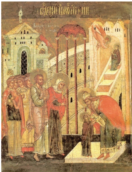
Введение во храм Пресвятой Богородицы. Икона. XVIII в.

Пресвятая Дева только еще недавно научилась говорить, но уже вся Ее душа влеклась к Богу. Сердце Ее было охвачено пламенем чистейшей любви Божественной. Жизнь среди людей этому удивительному ребенку с созревшей душой не казалась привлекательной. И Она Сама напомнила родителям об исполнении их обета. Печаль от разлуки с Дочерью боролась в душе Анны с радостью вручить Богу тот дар, ко-