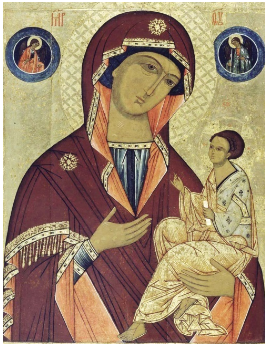
Грузинская икона Божией Матери. XVI в

Магометане, язычники знают о любви и вере христиан к таинственной Деве, и когда Царица Небес вставала на защиту Своих детей, они не пытались бороться с Ней, зная, что сила Пресвятой Девы Марии необорима.