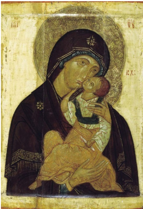
Яхромская икона Божией Матери. XV в.

В иконах Богоматери верующие люди, их писавшие, отразили Пречистую Деву в разные минуты духовной Ее жизни.