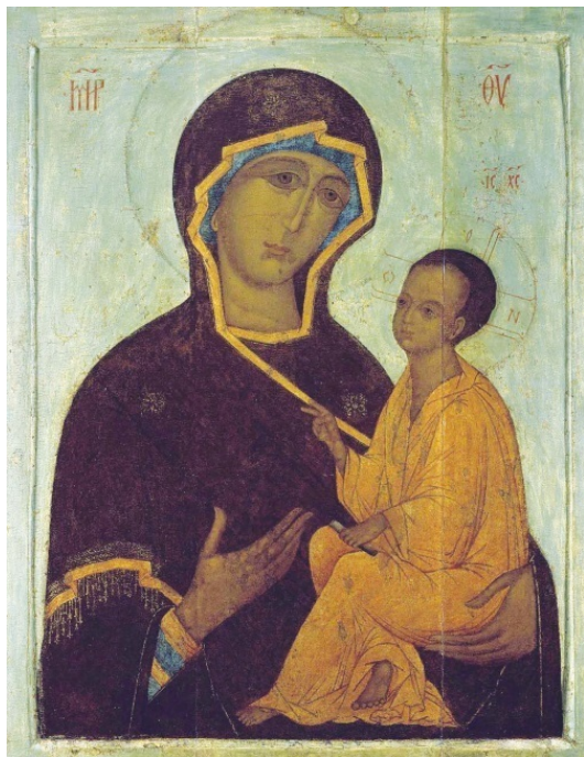
Тихвинская икона Божией Матери. XVI в.