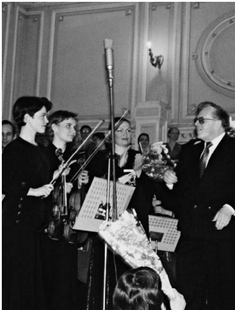
Исполнение вокально-симфонических фресок «Петр