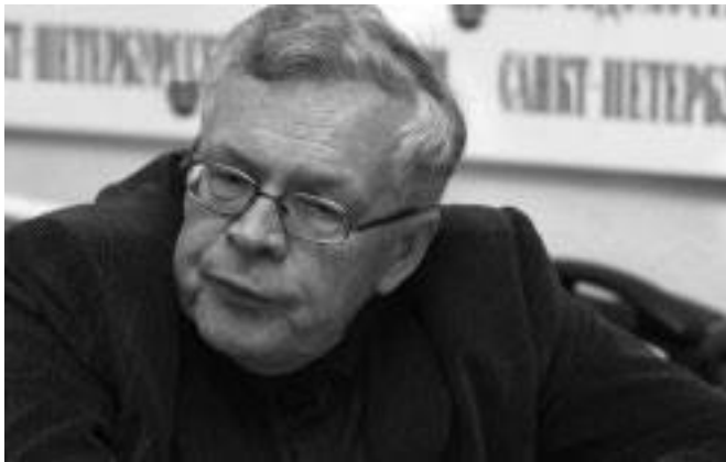
Пресс-конференция в редакции газеты «Санкт-Петербургские ведомости». 2005.