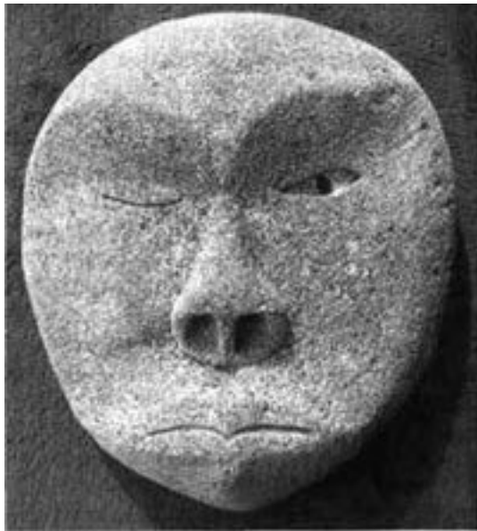
Рис. 1.1. Сказитель. Резьба по китовой кости

Нам всем хорошо знаком внешний мир, на который устремлен открытый глаз этой маски. Перед ним простирается чувственный материальный мир внешней реальности – обыденный мир, где есть время. Большую часть своего времени мы проводим в этом мире в окружении других людей, в нем мы ежедневно вынуждены решать неотложные проблемы, проживая наши жизни, суетные, направленные вовне и ориентированные на потребление. Также этому миру принадлежит наука с ее светским/материальным описанием че-