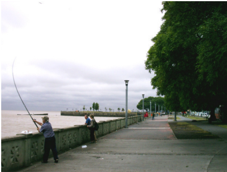
Набережная Рио де Ла Плата