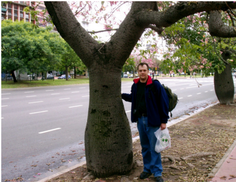
«Бутылочное» дерево (на фото – автор)

Миновав памятник Дон Кихоту и пройдя мимо вылезающего из-под земли прямо на тротуар эскалатора станции метро, мы возвратились в гостиницу. Пока ждали такси, я успел ознакомиться с местной газетой, писавшей, помимо прочего, о жестоком разгоне русского оппозиционного митинга в Санкт-Петербурге.