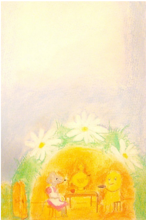
Художник: Татьяна Осколкова, 11 лет