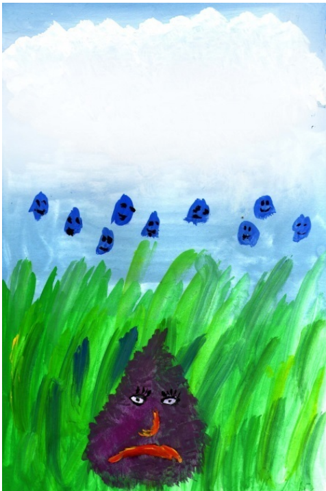
Художник: Артём Габеркорн, 9 лет