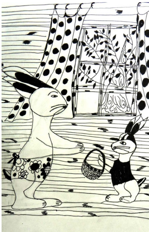
Художник: Дарья Ругнова, 9 лет