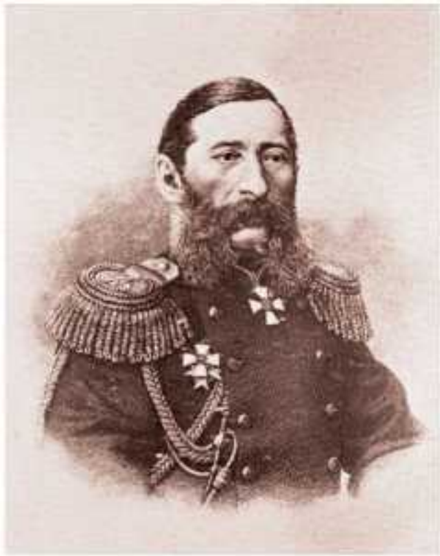
Граф Михаил Тариелович Лорис-Меликов

Но власть есть сила, и с позиции силы Александр не мог оставить без ответа состоявшиеся покушения. Такими ответами в разные годы стали контрреформы и ужесточение законодательства, введение в Москве, Санкт-Петербурге, Ки-