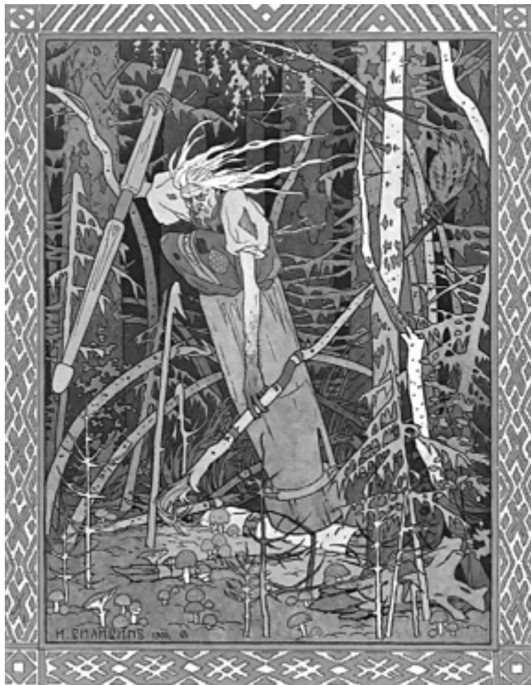
И.Я. Билибин. Баба-яга