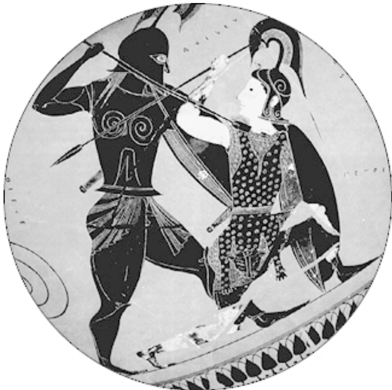
Ахилл убивает королеву амазонок Пендисилею. Фрагмент росписи греческой амфоры около 530 г. до н. э.

Примечательно, что говоря об амазонках, античные авторы неизменно подчеркивают их беспримерную отвагу и военную доблесть. В Римской империи высшей похвалой для воина считалось сказать ему, что он «сражался как амазон-