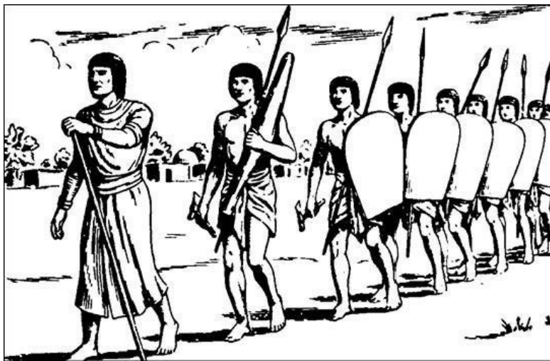
Египетские копейщики. XIII в. до н. э.

это было при прежних египетских царях, а с большой коалицией. Согласно древним источникам именно объединенные силы сирийцев и палестинцев во главе с царем Митанни преградили дальнейший путь египетской армии. В итоге недалеко от пограничной крепости, считавшейся воротами в Месопотамию и связывающей Египет с Сирией и Анатолией, произошло крупное сражение, вошедшее в историю не только как «Первая битва при Мегиддо», но и как первая битва, о которой имеются достоверные и достаточно подробные сведения.