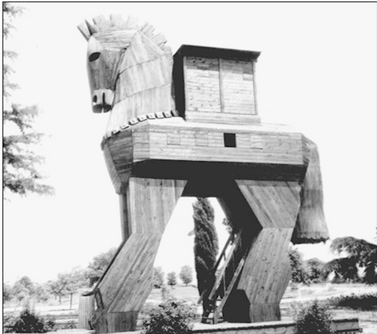
Так мог выглядеть троянский конь

Первыми в бой вступали боевые колесницы, затем «непрерывно одна за другой фаланги ахейцев двигались в бой на троянцев», «молча шагали, вождей опасаясь своих». Первые удары пехота наносила копьями, а затем рубилась мечами. С боевыми колесницами пехота боролась при помощи копий. Участвовали в бою и лучники, но стрела не считалась надежным средством даже в руках отличного лучни-