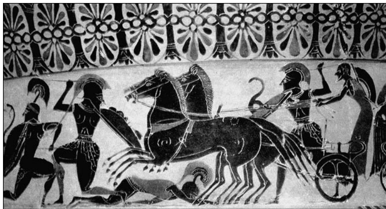
Боевая греческая колесница. Фрагмент росписи греческой вазы

Появление колесниц вызвало, по сути, целую революцию в военном деле. Став главной ударной силой в армиях, они решали не только исходы отдельных сражений – они решали судьбы целых государств!