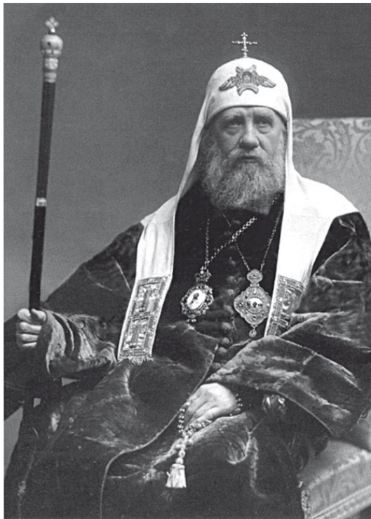
СВЯТИТЕЛЬ ТИХОН, ПАТРИАРХ МОСКОВ- СКИЙ И ВСЕЯ РОССИИ