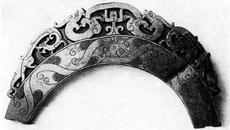
Нагрудное украшение из желтого нефрита, эпоха Враждующих царств

В эпоху Враждующих царств на бронзовых сосудах появились батальные и охотничьи сцены, что еще раз подтверждает приход реализма в искусство. Сплошные многофигурные рельефы постепенно перешли в круглую скульптуру: гончары придавали обычной посуде форму птиц или животных, щедро покрывая свои творения инкрустацией из золота и серебра.