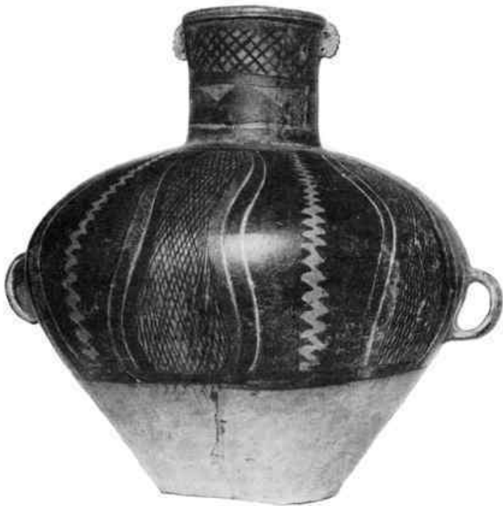
Расписной глиняный кувшин, эпоха неолита

Если верить преданиям, населению Желтой страны пришлось испытать первую большую войну. Против полчищ таинственных великанов с головами буйволов выступило войско под предводительством Хуанди.