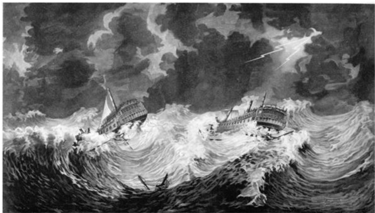
Флагманский корабль П. Паркера «Бристоль» (справа) 1780