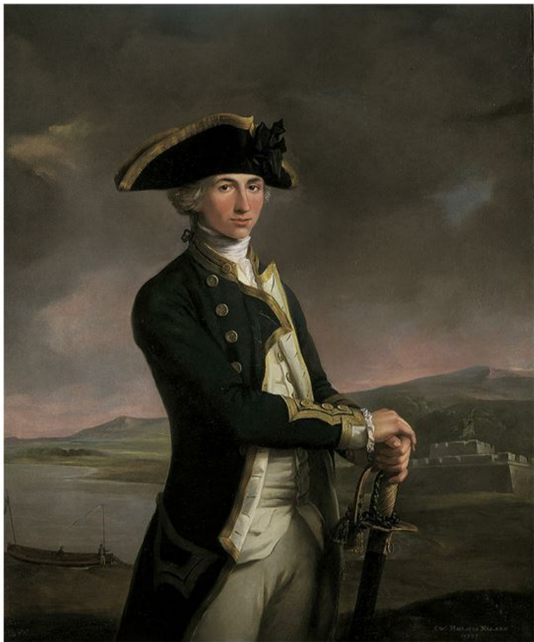
Нельсон в 1781 году. Художник Ф. Риггэйд

Своему бывшему начальнику, а теперь и другу капитану