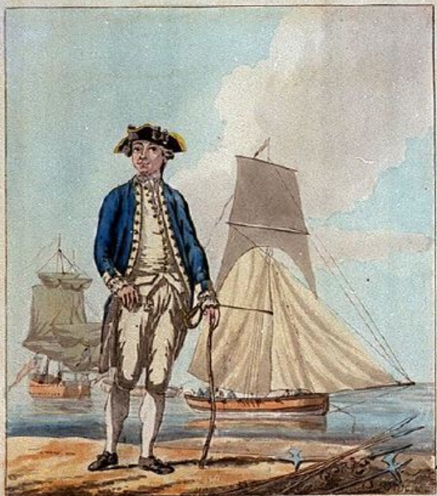
A LIEUTENANT with a Cutter

Enlighten - the Art. America 1777 by D. Brown, as Michael, West, Golden Square