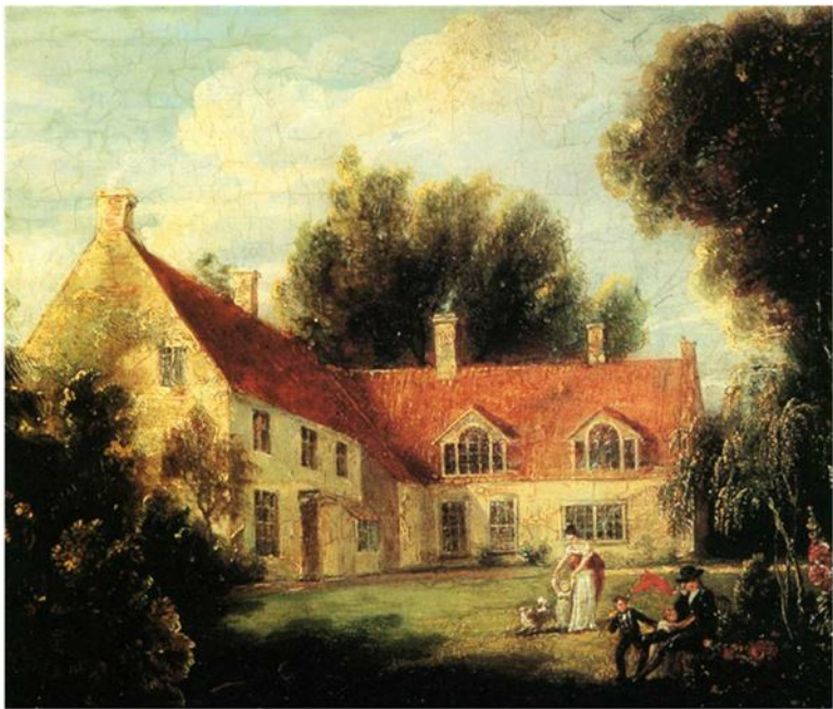
Дом в местечке Бернем-Торп, где в 1758 году родился Горацио Нельсон. Художник Ф. Пококк

Английский биограф нашего героя Г. Эджингтон пишет: «Бернем-Торп – сонная, захолустная, старинная деревушка в графстве Норфолк – приютилась на краю огромных соленых болот вокруг залива Уош. Здесь чувствуется та особая атмосфера, которую сохранили медвежьи углы, далекие от современной жизни и до сих пор похожие на картины Кон-