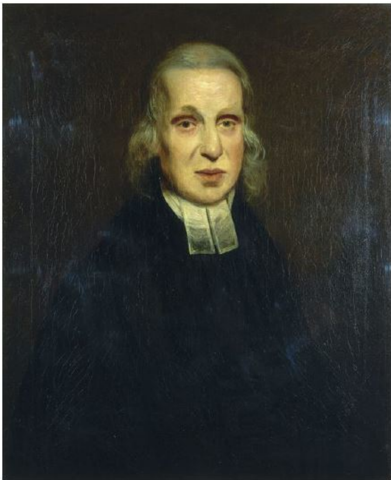
Отец лорда Нельсона преподобный Эдмунд Нельсон