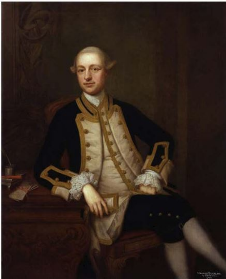
Капитан Морис Саклинг (1726 – 1778)