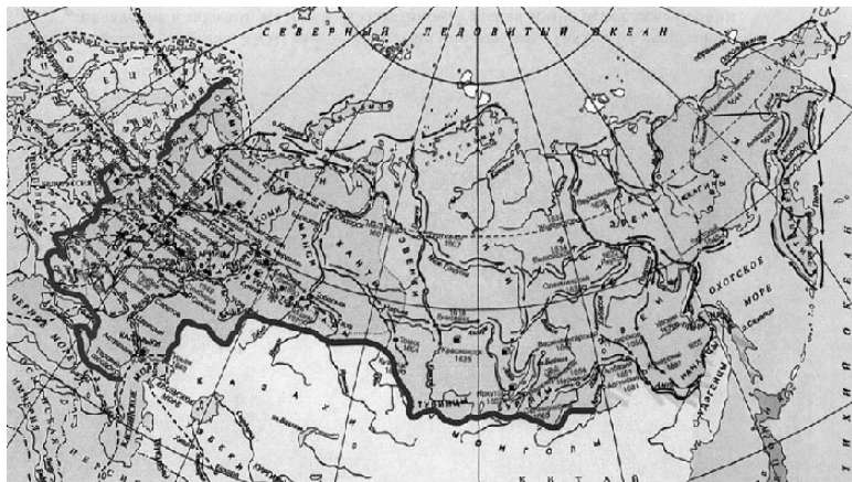
№ 7. Границы XVII в.