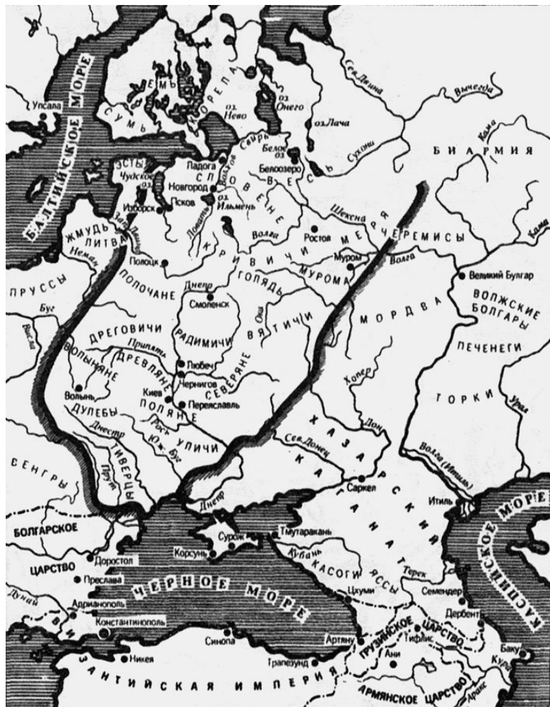
№ 3. Границы конца XI в.