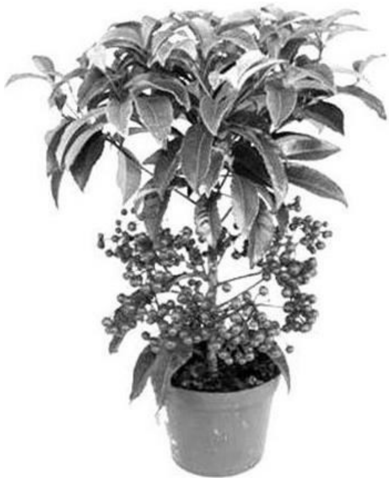
Рисунок 10 – Ардизия