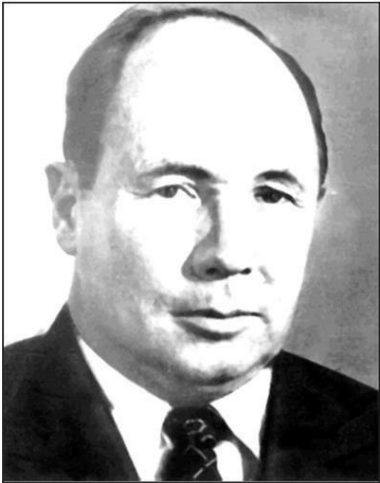
Рисунок 1 – Андрей Михайлович Гродзинский