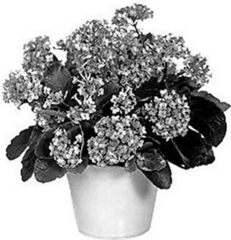
Рисунок 5 – Каланхоэ

и растения, ионизирующие воздух (хлорофитум хохлатый, циссус, фикус Бенджамина, аспарагус перистый, диффенбахия, каланхоэ, филодендрон, папоротник, сансевиерия трехполосная, пеларгония, хвойные растения и др.).