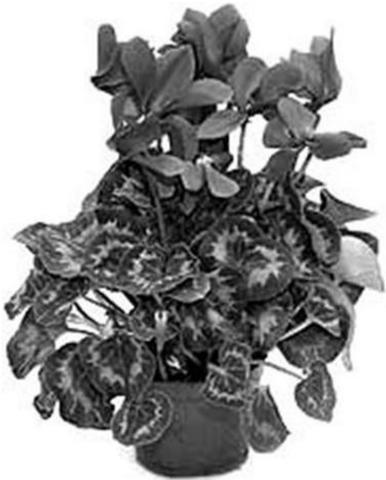
Рисунок 11 – Цикламен