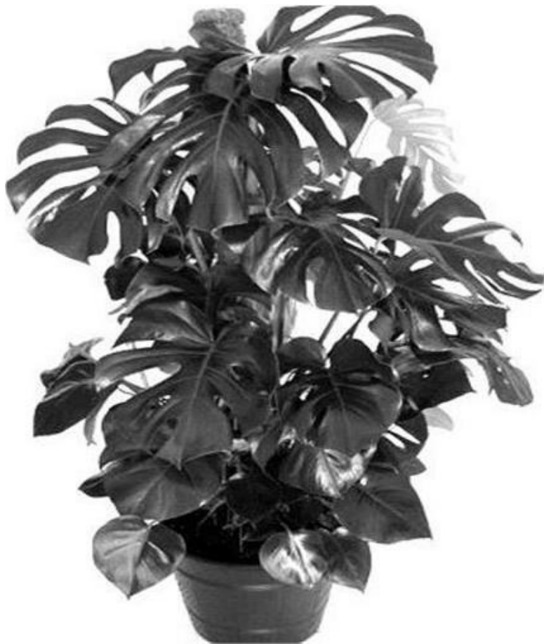
Рисунок 4 – Монстера

3 группа – растения, очищающие воздух от вредных газов