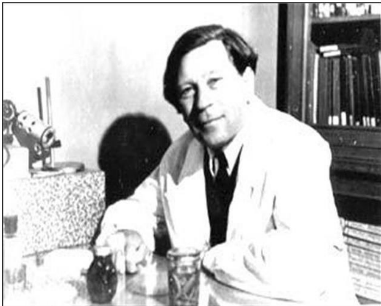
Рисунок 2 – Борис Петрович Токин

Фитонциды комнатных растений способны изменить и улучшить состав воздушной среды, подавляя жизнедеятельность патогенных микроорганизмов и нейтрализуя вредные химические вещества, содержащиеся в воздухе, а также способны положительно воздействовать на организм человека, успокаивая его нервную систему.