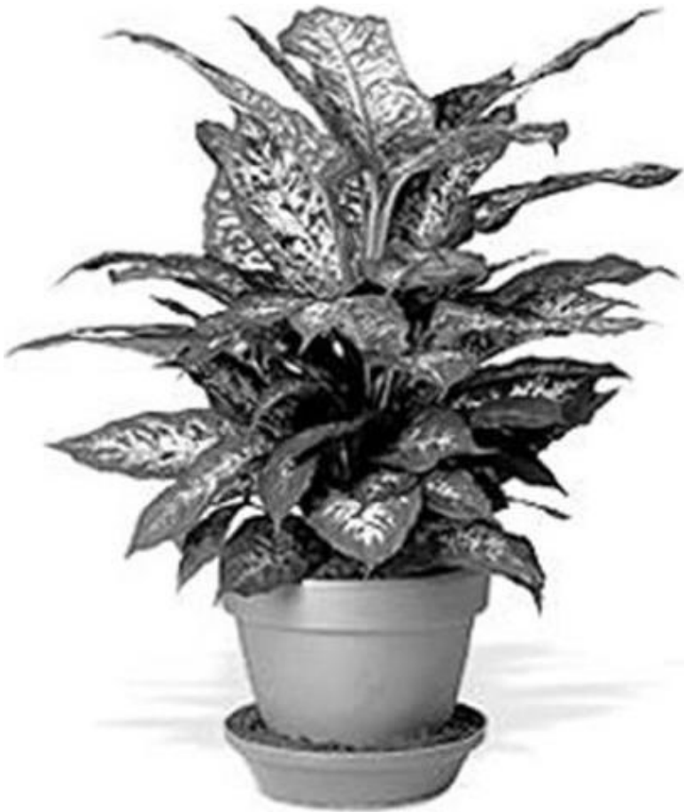
Рисунок 7 – Диффенбахия

Намечается растущая тенденция к выведению пестро-