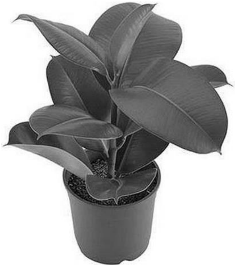
Рисунок 6 – Фикус

В наши дни декоративнолистные растения разделяют популярность с цветущими. Их до сих пор используют как фон