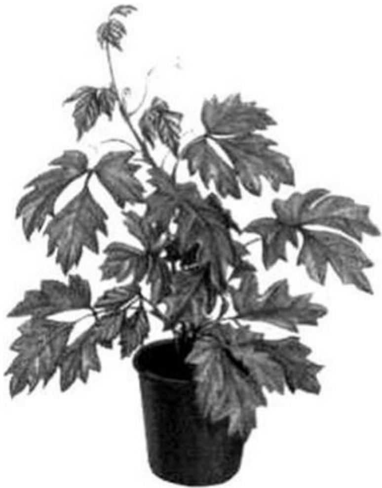
Рисунок 3 – Циссус