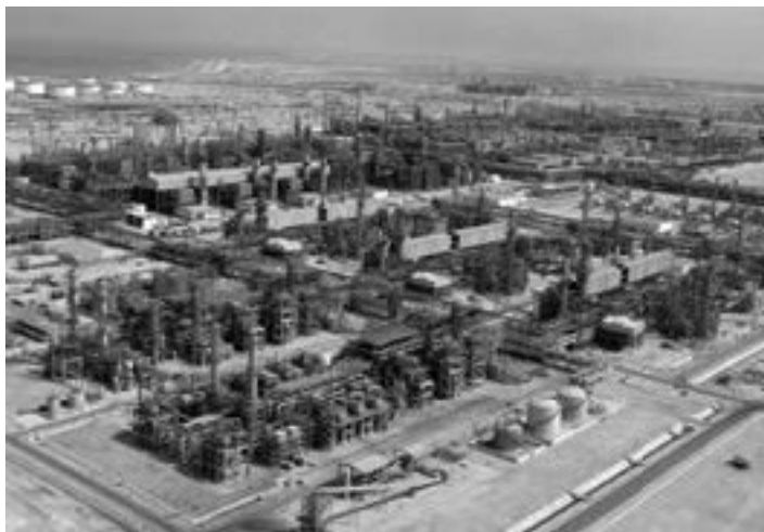
Завод по производству СПГ, проект Qatargas (Катар)

Тем более что в 1992 году, когда Россия была слаба и когда наш МИД сказал, что нам посольство в их стране не нужно, Катар взмолился, сказав, что они потеряют лицо, и даже предложил помещение на бесплатной основе.