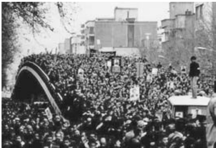
Массовые демонстрации в Тегеране (Иран)(1979 г.)

визация, когда провозгласила «Богатство угодно Богу», исключив алчность из числа смертных грехов (формально перечень остался прежним, но кого теперь это уже интересует). Была изменена базовая этика существования Запада. Именно это позволило Западу совершить невероятный рывок вперед и опередить другие цивилизации. Надолго ли – непонятно, но пока это так.