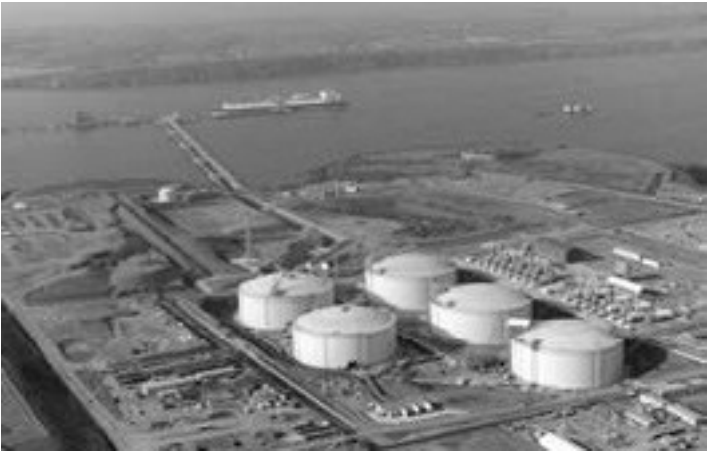
Терминал South Hook, Англия

Структура ВТБ «ВТБ-Капитал» в июле 2011 года рассыпалась бисером и провела презентацию предложения по продаже Катару двух газовых полей. Ситуация до сих пор висит и, судя по всему, видимо, тихо скончается без результата.