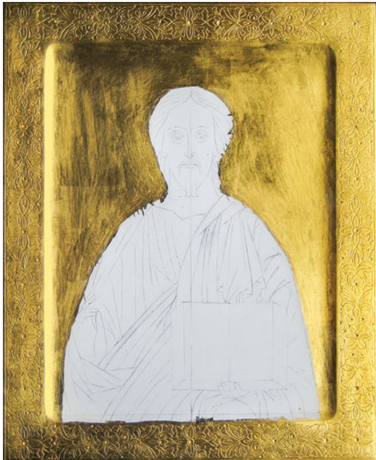
Золочение ковчега и полей. Икона Господь Вседержитель. Мастерская Виктора Юскова