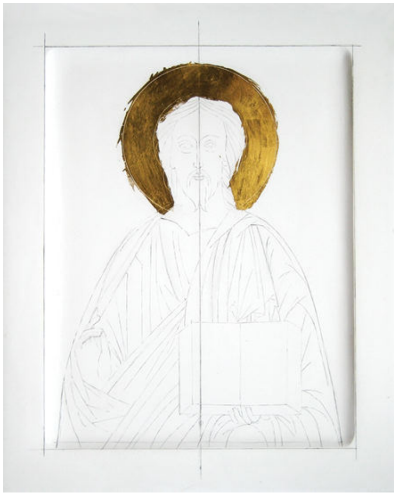
Золочение нимба. Икона Господь Вседержитель. Мастерская Виктора Юскова