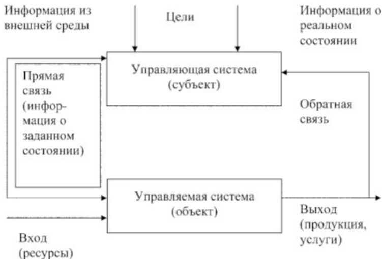
Рис. 1.6. Схема системы управления организации

Очевидно, что именно система управления организации имеет возможность адекватно реагировать на внешние и внутренние воздействия, что придает организации способность к адаптации в изменяющихся условиях, делает ее саморегулируемой.