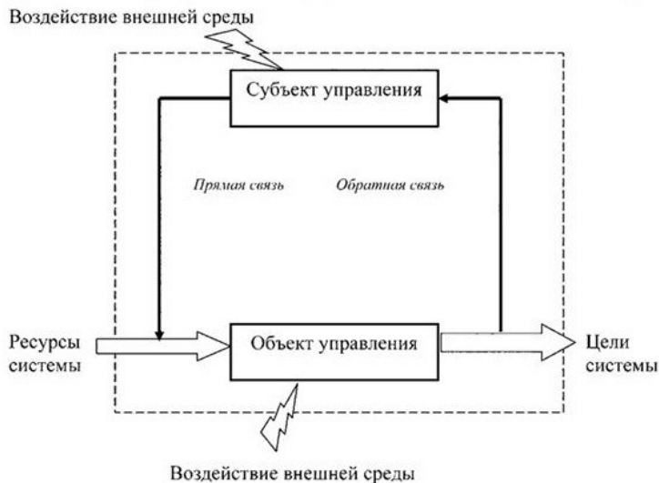
Рис. 1.2. Система управления организации в виде контура управления