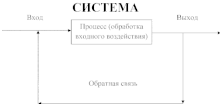
Рис. 1.4. Схема функционирования системы

Управление – это процесс воздействия на систему с целью поддержания заданного состояния или перевода ее в новое состояние. Система управления это: