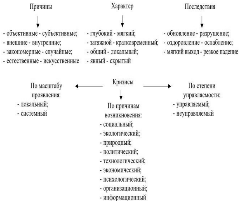
Рис. 1. Типология кризисов 2

В 90-х гг. XIX в. Российская империя переживала бурный рост. Появлялись новые промышленные предприятия, активно строились железные дороги, в страну пришли иностранные инвесторы. Рост экспорта сельскохозяйственной продукции способствовал притоку в Россию валютной вы-