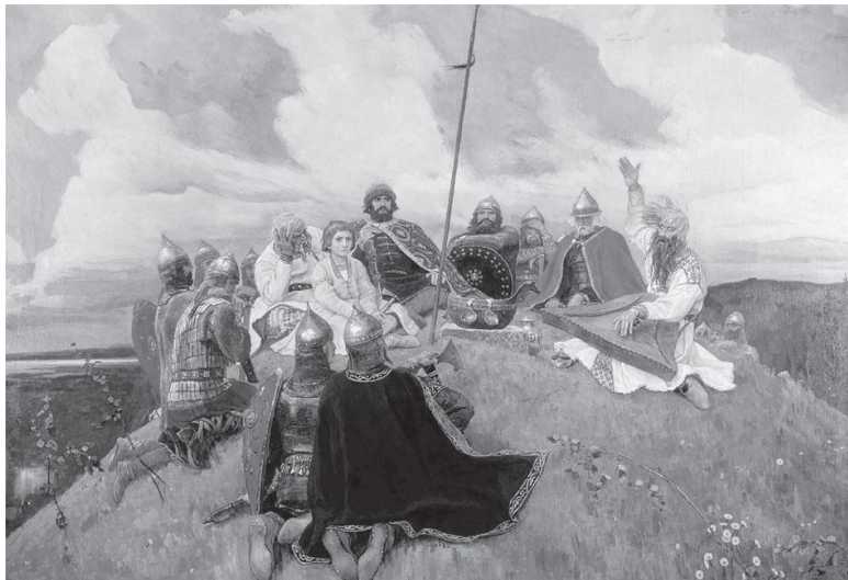
В. Васнецов. Баян, 1910. Вещий Баян слагал песни и сказания о деяниях князей