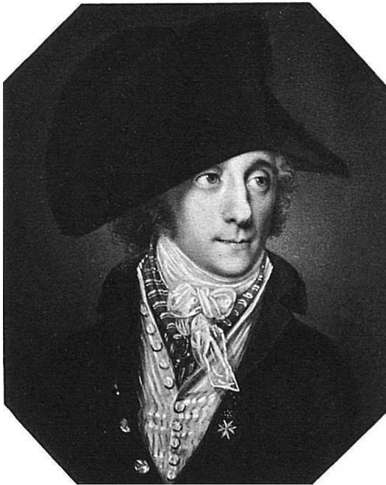
Алексей Андреевич Ржевский (1737—1804) – действитель-