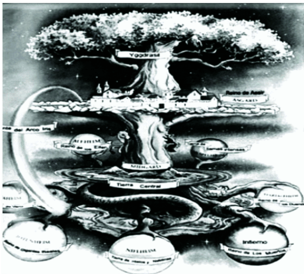
Рис. 3. Иггдрасиль, мифическое дерево между мирами (Википедия)

мирами представляет собой нечто такое, что мы можем развивать в самих себе.