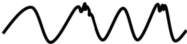
Рис. 4. Наши движения плавные и немного непредсказуемые

себе просто быть движимым пространством, вот как это выглядит ( Арни медленно передвигается, затем слегка дергается ). У каждого из вас будет свой собственный опыт пространства и движения в нем. Некоторые люди будут стоять на месте. Но в данный момент быть движимым пространством для меня означает, что я более или менее перемещаюсь туда-сюда – более или менее и о-о-о , время от времени есть также небольшое подергивание и вдобавок может быть еще что-то. Пожалуй, я нарисую это движение на доске.