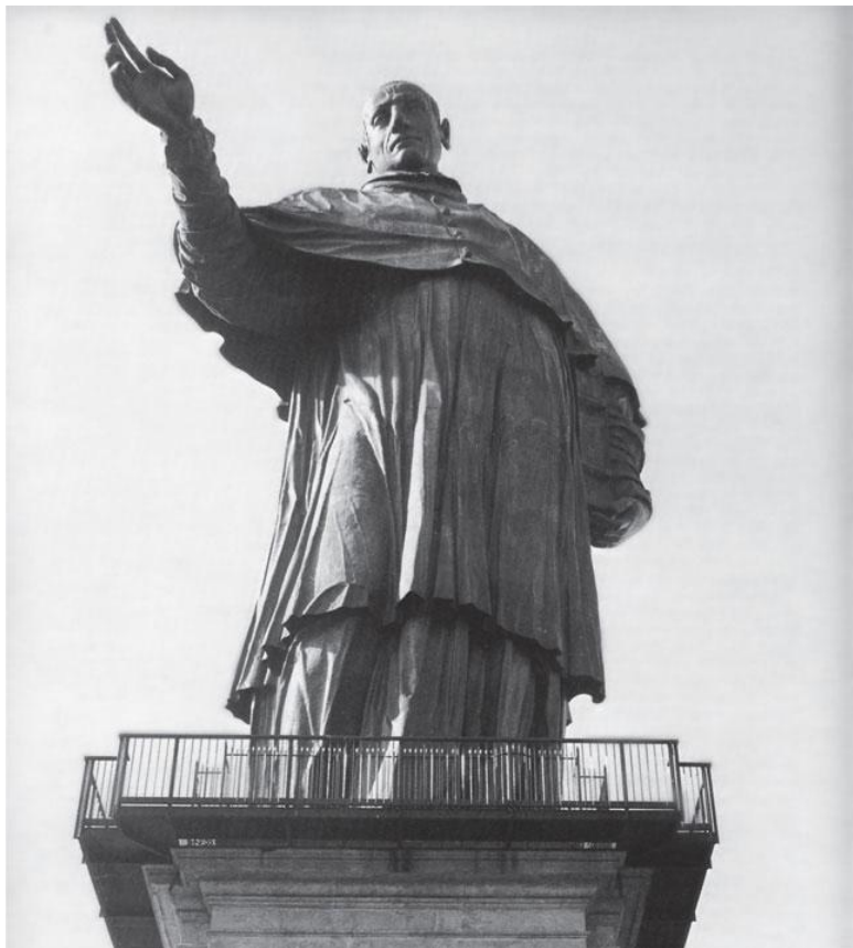
Статуя святого Карло Борромео, Арона

Поэтому со временем я стал воспринимать архитектуру как инструмент, позволяющий чему-либо произойти. Надо