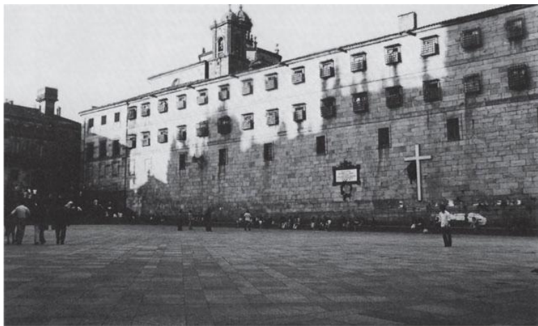
Монастырь Сан-Пелайо в Сантьяго-де-Компостеле

этих конструкций. Увидев в Нью-Йорке полное собрание работ Эдварда Хоппера, я понял все это применительно к своей архитектуре. Такие картины, как «Chair Car» [«Сидячий вагон»] и «Four Lane Road» [«Четырехполосное шоссе»], напомнили мне о неподвижности тех вневременных таинств, вечно накрытых столов, невыпитых кубков, вещей, выходящих за пределы себя самих.