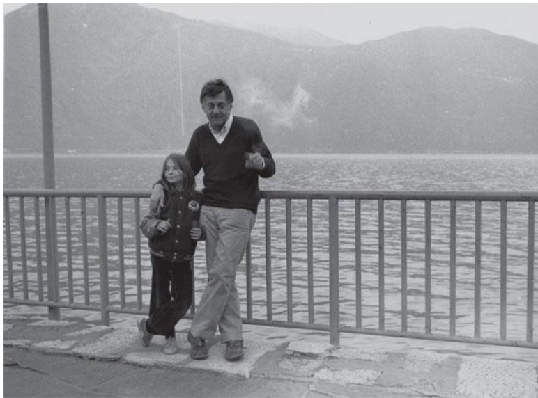
Альдо Росси с дочерью Верой, ок. 1980