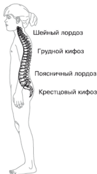
Рис. 1.2. Изгибы позвоночника

У ребенка, ведущего естественный, подвижный образ жизни, изгибы позвоночного столба почти всегда являются оптимальными для его роста и веса. Под нарушениями осанки понимают сглаживание или увеличение физиологических изгибов позвоночника. Это еще не болезнь, и такие изменения обратимы. Искривлением позвоночника (сколиозом) называют появление дополнительных изгибов во фронтальной плоскости и скручивание позвоночника. В подавляющем большинстве случаев деформирования позвоночника формируются в раннем детстве, а потом лишь прогрессируют. У взрослого человека последствия неудобной позы быстро дают о себе знать болями в спине – в первую очередь страдают корешки спинномозговых нервов. По этой причине он