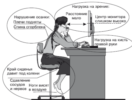
Рис. 1.1. Опасности для здоровья, которые подстерегают человека, работающего за компьютером