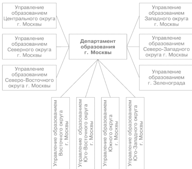
Рис. 1.1. Общая схема управления образованием г. Москвы

Психологическая служба, ориентированная на психологическое обеспечение образовательного процесса, представлена во всех структурных подразделениях образования. Департамент образования взаимодействует по вопросам психологической службы со всеми окружными управлениями образования, а через них – со всеми образовательными учреждениями города. Управление психологической службой в городской системе образования можно представить в ви-