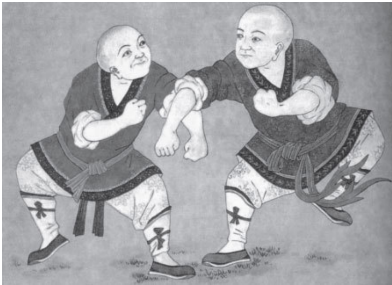
Настенные росписи «Храма десяти тысяч будд», возведенного в 16 веке

Именно в это время появляются первые серьезные трактаты об искусстве боя с оружием. Вероятно, самым первым можно считать трактат «Речения с секирой на коне» («Маюэпу»), созданный приблизительно в V–VI веках.