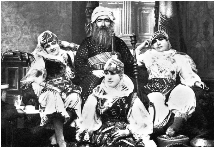
Турецкий паша в окружении любимых жен. Фото 1880 г.

Кто-то увидит в этом некую дискриминацию, но разве найдется в мире женщина, которая отказалась бы от собственных покоев, где она может уединиться, отдохнуть или посудачить со своими подругами, что не всегда уместно в присутствии даже любимого супруга, свекрови или детей?