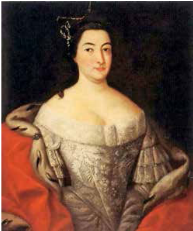
Царевна Екатерина Иоанновна.

Рубеж 1680-х – 1690-х годов, на который пришлось рождение детей у братьев-соправителей, стало последним периодом, когда при появлении царских отпрысков соблюдались многочисленные обычаи московского двора. Осведом-