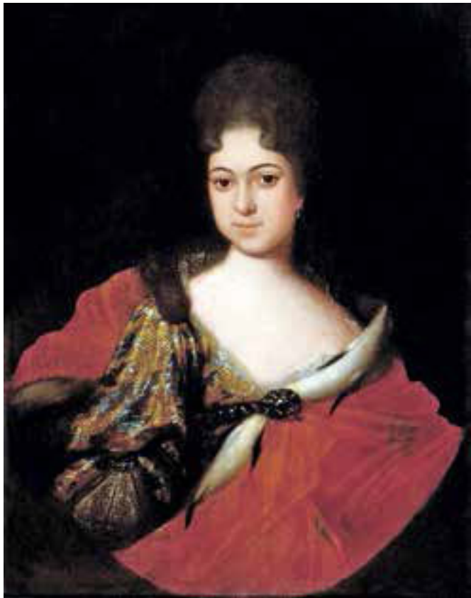
Царевна Прасковья Иоанновна. Художник И. Н. Никитин.

Следующим этикетным шагом были смотрины. Младенца выносили в соседнюю богато убранную палату, где показывали отцу-царю и другим близким родственникам, боярыням