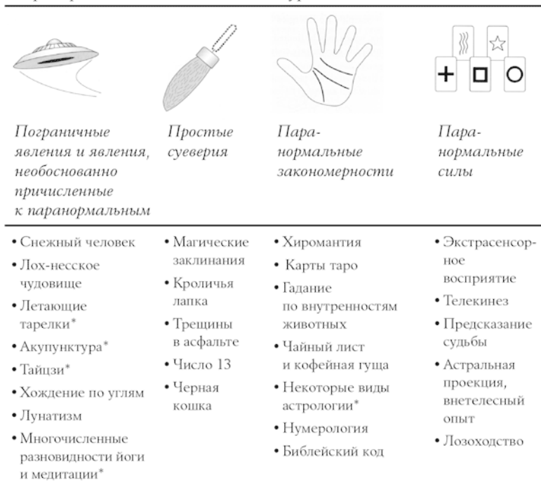
Таблица 1.1 Continuum Mysteriosum

* Многие паранормальные явления могут быть представлены в нескольких вариантах и классифицироваться по-разному. К примеру, утверждение о том, что акупунктура вызывает выработку в мозгу эндорфинов, не является паранормальным. Неопределенное утверждение о том, что акупунк-