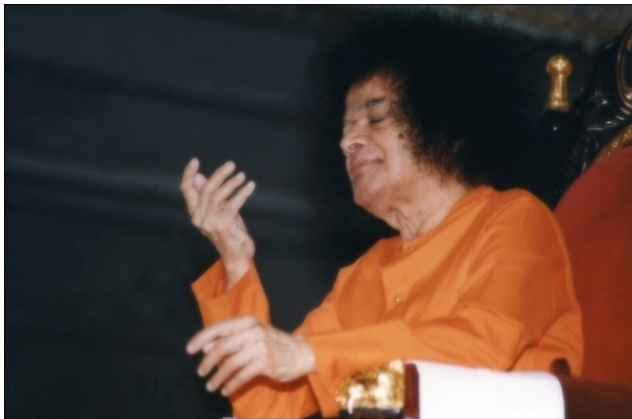
Сатъя Саи Баба