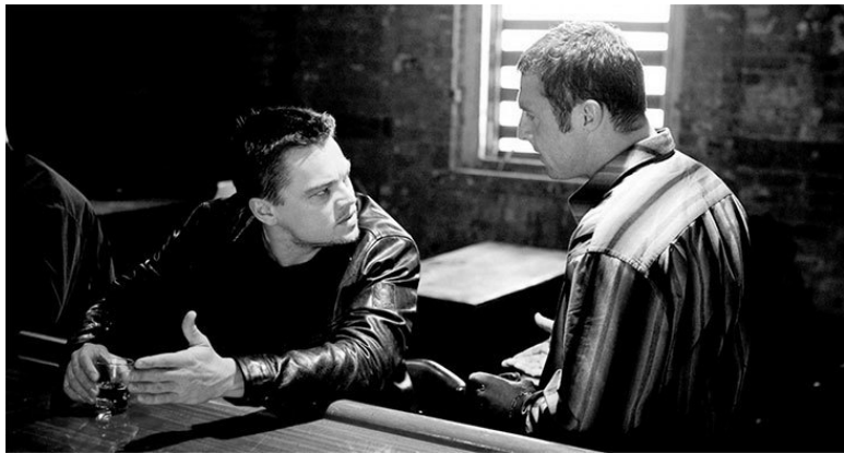
Кадр из криминально-драматического триллера режиссера Мартина Скорсезе «Отступники» (2006)