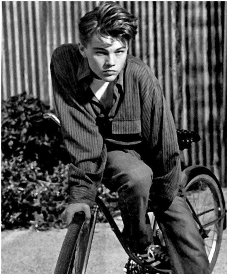
Леонардо Ди Каприо в детстве