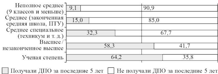
Рис. 2. Доля включенных в систему ДПО среди россиян с различным уровнем образования, 2015 г., % от работающего населения

Надо отметить, что размер и тип поселения в меньшей степени, чем уровень образования, влияют на включенность россиян в систему дополнительного образования. Так, даже в сельских поселениях свыше трети работающего населения за последние пять лет повышали свой профессиональный уровень. В городах, особенно административных центрах субъектов Российской Федерации, включая Москву, данный показатель самый высокий – около 50 % (рис. 3). Тем не менее разрыв между Москвой и селами по доле получавших ДПО не очень велик и составляет всего 14,5 % – это намного меньше, чем разрыв в 55,1 % между полярными по уровню их образования группами. Таким образом, для активности в сфере ДПО сейчас не так важно, где живет человек, как то, каков его исходный образовательный уровень.