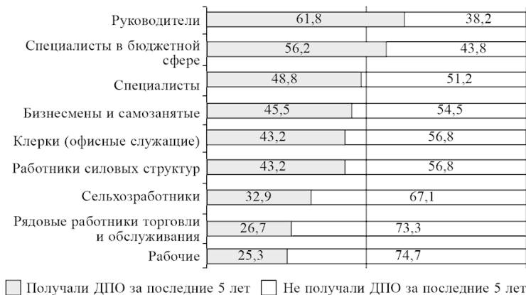
Рис. 4. Доля включенных в систему ДПО среди россиян из разных профессиональных групп, 2015 г., % от работающего населения

Наиболее часто за последние пять лет совершенствовали свое образование руководители и профессионалы (50 % и более), причем специалисты в бюджетной сфере (например, врачи и педагоги) делали это на 7 % чаще, чем остальные специалисты. Такая разница между специалистами бюджетной и небюджетной сфер объясняется тем, что первые в отличие от вторых обязаны периодически подтверждать свою квалификацию и проходить обучение (например, врачи раз в пять лет проходят сертификацию, включающую обучение). Сравнительно реже получали дополнительное образование бизнесмены и самозанятые, хотя и среди них соответству-