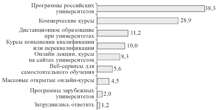
Рис. 5. Формы дополнительного образования, использовавшиеся работающими россиянами, 2015 г., % от работающего населения, получавшего ДПО в предыдущие пять лет

Как правило, в течение пяти лет получавшими дополнительное образование использовалась какая-то одна его форма. Однако попадаются и россияне, использовавшие две и более его форм, и вероятность встретить таковых в разных группах разная. Это хорошо видно при обращении к показателю среднего числа форм ДПО, использовавшихся в течение последних пяти лет в разных группах. Так, в возрастной когорте 26–35 лет этот показатель 1,19 против 1,11 среди тех, кому от 46 до 54 лет; у имеющих высшее или незаконченное высшее образование он 1,18 против 1,07 в группе работников со средним специальным образованием; в Москве он 1,29 против 1,09 в селах; среди руководителей он 1,28