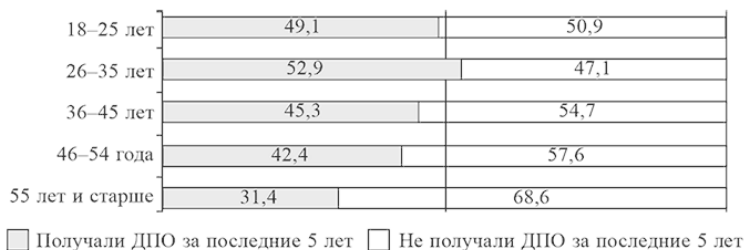
Рис. 1. Доля включенных в систему ДПО россиян различного возраста, 2015 г., % от работающего населения

возрастной когорте меньше трети ее представителей повышали свой профессиональный уровень за предыдущие пять лет.