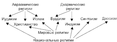
Рис. 1. Современные религии

(от имени Авраама, почитающегося во всех трех патриархом). Эти религии также называют монотеистическими (от греческих слов «моно» – «один» и «теос» – «бог»), так как они провозглашают единобожие – почитание Единственного Бога-Творца. В противоположность им, индуизм и основанный на нем буддизм объединяют под именем дхармических (от санскритского слова «дхарма» – «закон») религий. Их общей чертой является вера в перерождение всех живых существ после смерти в новом теле. Дхармические, как и многие другие религии, являются политеистическими (от греческих слов «поли» – «много» и «теос» – «бог»), то есть допускающими поклонение многим богам. Приверженцы монотеистических религий называют политеистов «язычниками».