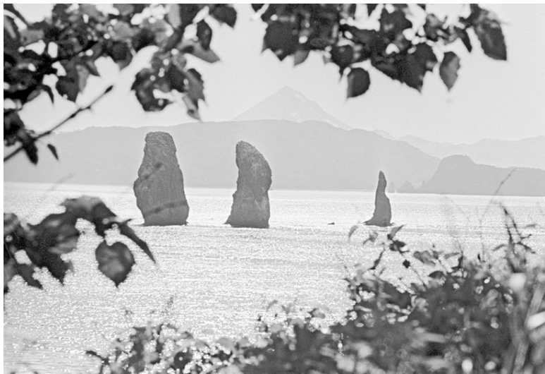
Скалы «Три брата» в Авачинской бухте у выхода в открытый океан