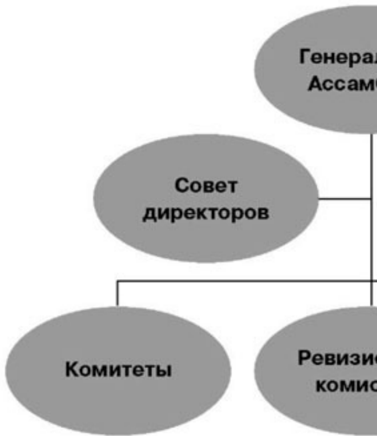
Рисунок 6. Система руководящих органов федерации плавания Греции

Следует кратко охарактеризовать полномочия каждого из данных органов.