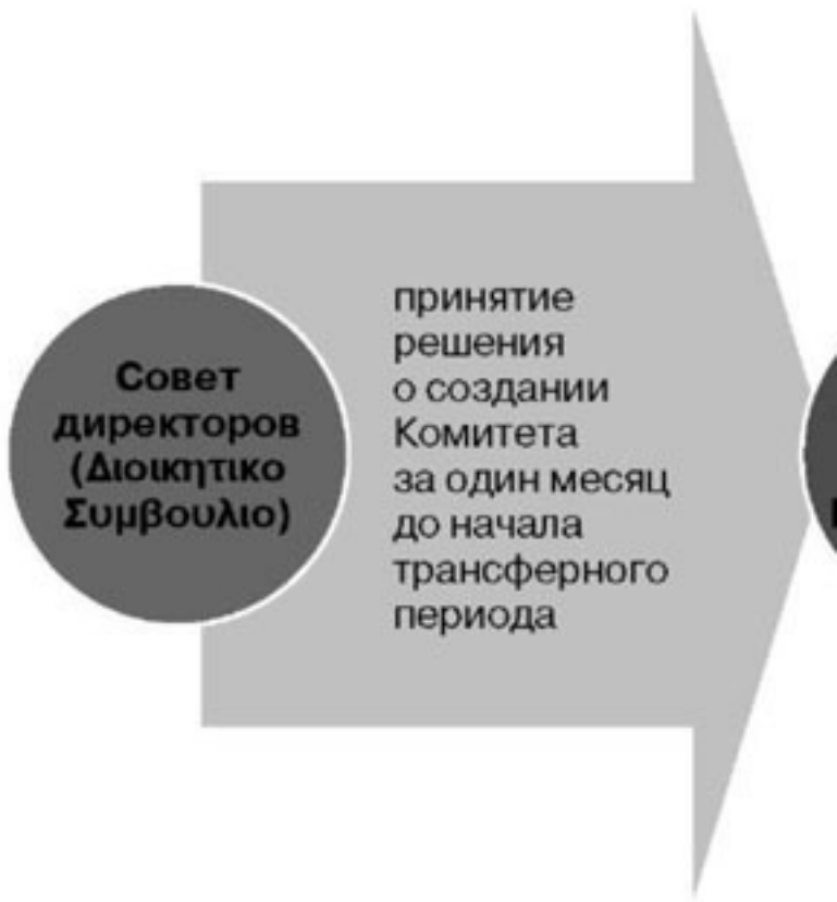
Рисунок 7. Орган, рассматривающий вопросы трансфера спортсменов в Греческой федерации плавания

Таким образом, Комитет по трансферам принимает ре-