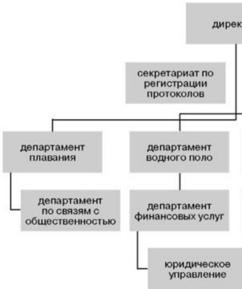
Рисунок 2. Структура центрального учреждения