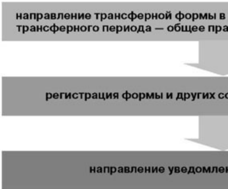
Рисунок 8. Подача трансферной формы в Греческой федерации плавания

шения, которые должны быть ратифицированы Советом Директоров. Правила отдельно упоминают, что решения получают юридическую силу от Совета директоров.