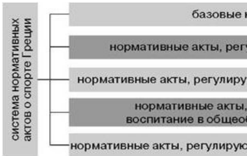
Рисунок 1. Система нормативных актов о спорте (в том числе о плавании) Греции

Первый уровень нормативных актов следует разбить на несколько блоков.