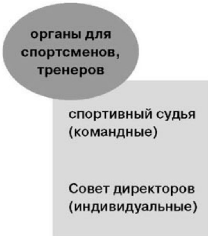
Рисунок 5. Система дисциплинарных органов Федерации плавания Греции

Правила подробно не рассматривают процесс рассмотрения дел в юрисдикционных органах, производя отсылку к