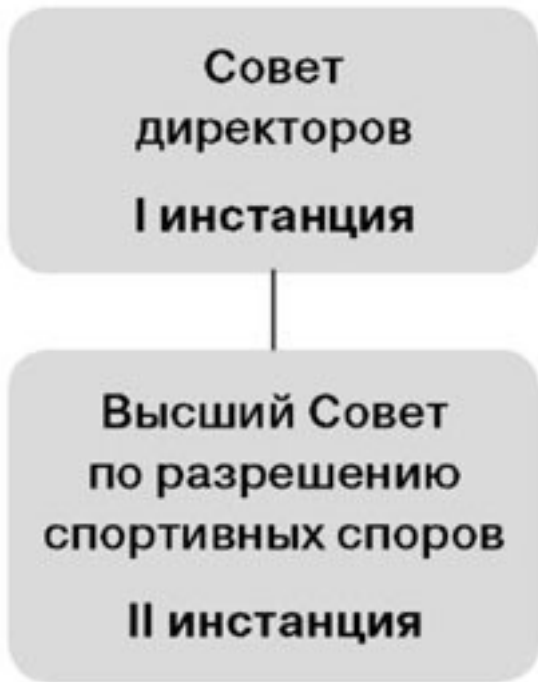
Рисунок 3. Система (юрисдикционных) органов для разрешения споров в индивидуальных дисциплинах

Особенностью данной системы является то, что, несмотря на упоминание в Правилах № 3 Высшего Совета по разрешению спортивных споров, последний не входит в структуру спортивной федерации и является независимым, непостоянно действующим органом, которому могут быть переданы споры в целях апелляционного обжалования решений