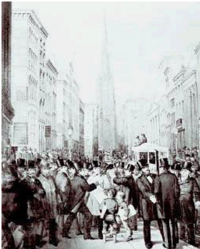
Финансовая паника на Уолл-стрит в 1857 году.

– Те, кто вовремя это понял, поспешили от акций избавиться. Остальным было плохо.