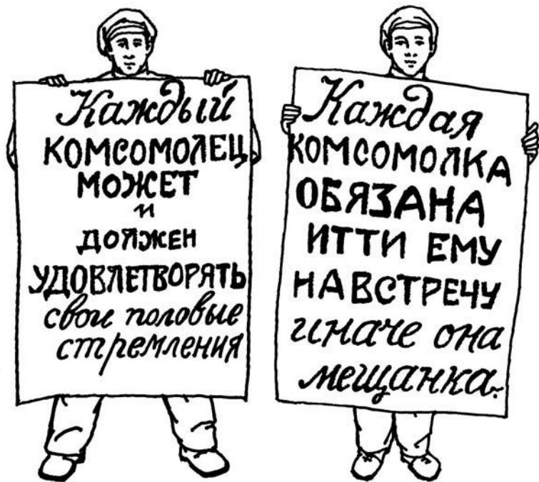
Рисунок взят из пропагандистской брошюрки 1920 года, хранящейся в Музее Кирова в Санкт-Петербурге. На нем изображена сценка из комсомольского спектакля времен Гражданской войны. Речь идет о половом вопросе, в общем, и о свободной любви в частности

ставлял парням право выбирать партнершу из числа пришедших на собрание комсомолок.