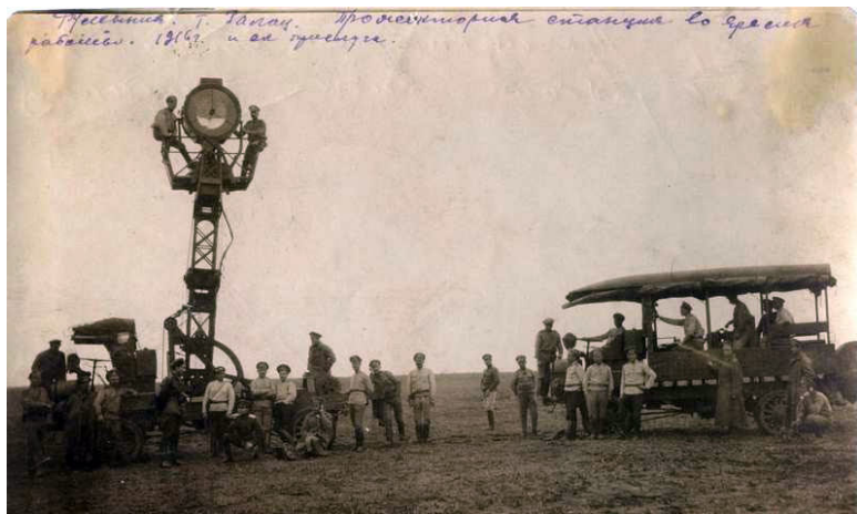
Прожекторная станция во время работы 4-й Сибирский корпус. Румыния, г. Галац, 1916 г.