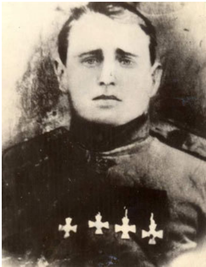
Павел Осипович Показанов (1893–1919), полный георгиевский кавалер Первой мировой