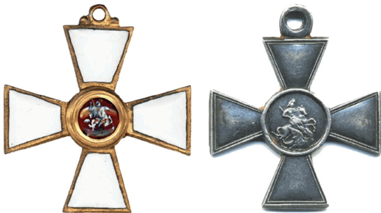
Орден Св. Георгия (слева) и Георгиевский крест (справа)

флангу немцев, занявших д. Боровую, заставил их бросить занятую ими позицию и отступить за р. Неман» 84 .