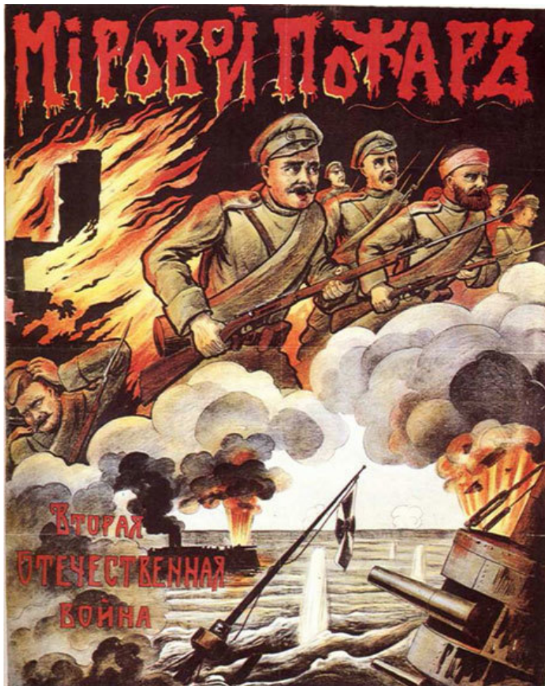
«Мировой пожар. Вторая Отечественная война» (плакат 1914 г.)