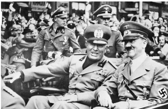
Бенито Муссолини и Адольф Гитлер, Германия

Очевидно, американские генералы оценили по достоинству способности самого известного нацистского диверсанта Отто Скорцени. Который затем, по некоторым данным, во время «холодной войны» готовил диверсантов против Советского Союза.