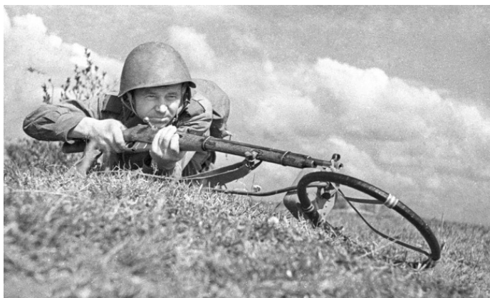
Сапер обезвреживает немецкую мину

Когда дошло до дела, некоторых мальчишек отчислили. Они не могли перебороть свой страх.