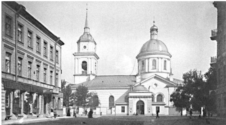
Церковь Покрова в Большой Коломне. 1900-е гг.

В церкви обустроили три престола: главный – во имя Покрова Пресвятой Богородицы освящен 30 сентября 1812 года; правый – во имя собора святого Иоанна Крестителя – 1 ноября 1808 года; левый – во имя святой равноапостольной Марии Магдалины – 20 ноября 1808 года. В иконостасе – образа работы академиков братьев Малковых. Главной святыней храма являлся чудотворный образ святителя Николая.