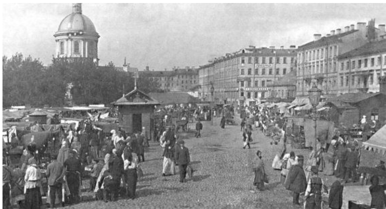
Базар на Покровской площади в Большой Коломне. 1900-е гг.

Археологи при раскопках нашли также перстень-печатку из белого металла с изображением бычьей головы и надписью на нем: «Сей перстень Дмитрия Шатина». Оказалось, что купец Шатин был хозяином салотопни, расположенной в устье реки Фонтанки. Он поставлял сало для стапелей судостроительной верфи и в Покровскую церковь.