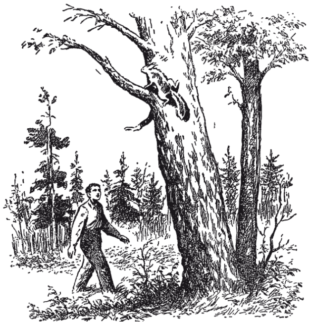
Рис. 1. «Плутовка отступала в обратную сторону»

– Конечно, как и Земля вокруг оси. Вообразите, однако, что вращение Солнца совершается медленнее, а именно что оно делает один оборот не в 26 суток, а в 365\frac{1}{4} суток, то есть в год. Тогда Солнце было бы обращено к Земле всегда одной и той же своей стороной; противоположной половины, «спины» Солнца, мы никогда не видели бы. Но разве стал бы кто-нибудь утверждать из-за этого, что Земля не кружится