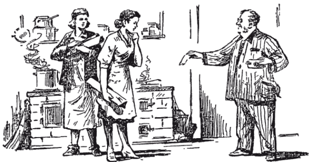
Рис. 2. «В возмещение расходов он уплатил соседкам 8 рублей»

– Товарищи, – взял слово тот, кто затеял игру и считался теперь председателем собрания. – Окончательные решения головоломок давайте пока не объявлять. Пусть каждый ещё подумает над ними. Правильные ответы судья огласит нам за ужином. Теперь следующий. Очередь за вами, товарищ пионер!