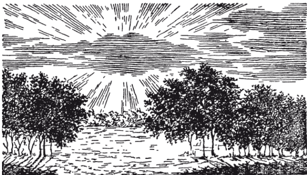
Рис. 4. Расходящиеся лучи от спрятанного за облаком солнца