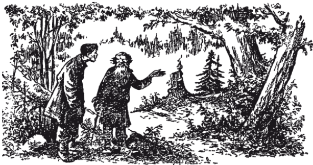
Рис. 5. Старик повёл крестьянина в глубь леса

Заглянул крестьянин в кошелёк, и что же? – деньги в самом деле удвоились! Отсчитал из них старику обещанные 1 руб. 20 коп. и попросил засунуть кошелёк вторично под чудодейственный пенёк.