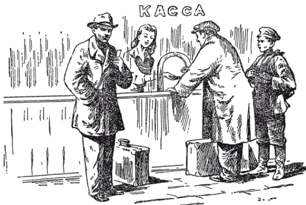
Рис. 3. «Продаю железнодорожные билеты»

– Представьте, что вполне возможно. Дед доказал мне это. Сколько же лет было каждому из нас?