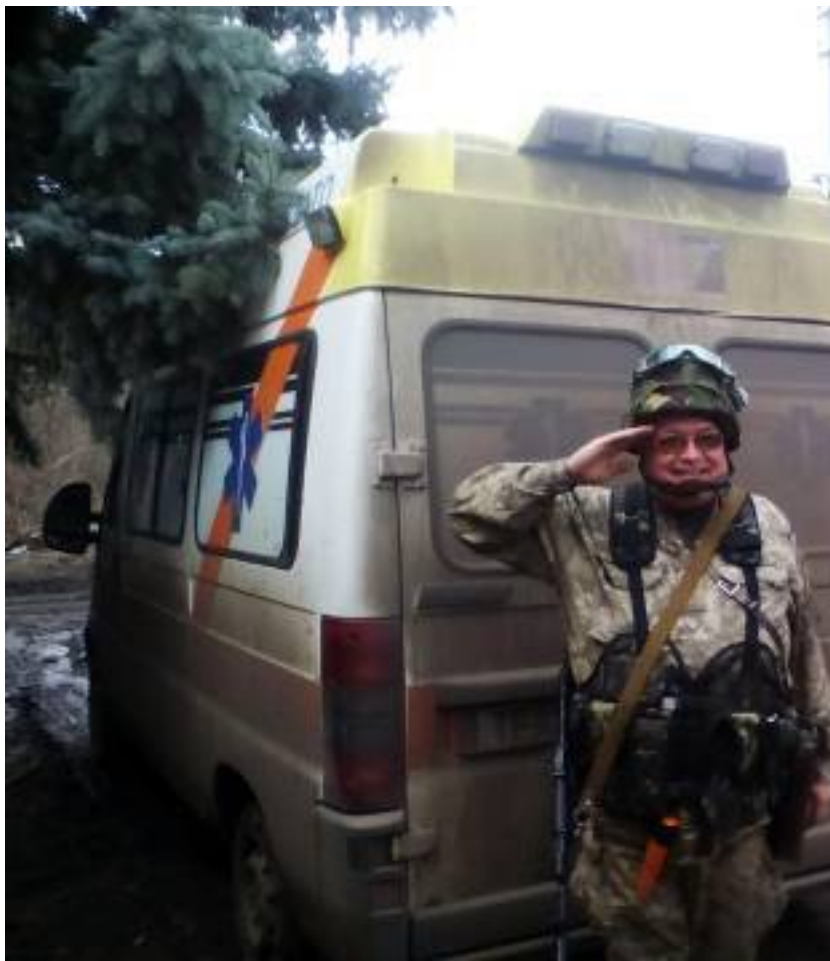
Офицерская рота (в учебке)