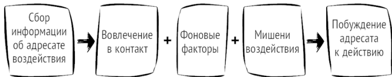
Рис. 2. Модель скрытого управления [Шейнов, 2007]

Фоновые факторы (фон) – использование состояния сознания и функционального состояния адресата и присущих ему автоматизмов, привычных сценариев поведения; создание благоприятного внешнего фона (доверие к инициатору, его высокий статус, привлекательность и т. п.).